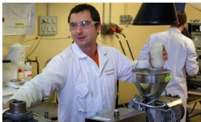
Projekto „Mabiolac“ uždavinys – kurti naujas biologiškai skylančias medžiagas iš pieno rūgšties