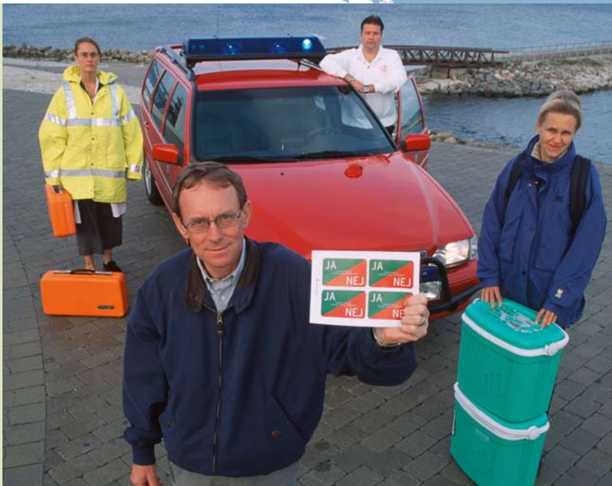
Danija ir Švedija bendradarbiauja organų donorystės srityje

problemų, ypač susijusių su pasienio bendradarbiavimu. Daugelyje kitų pasienio regionų, ypač naujosiose valstybėse narėse, tokios sutartys iš viso nebuvo sudarytos. Būtent todėl Komisijos narys Barnier, pats kilęs iš pasienio regiono (Savoijos, Prancūzija), 2004 m. trečiojoje ekonominės ir socialinės sanglaudos ataskaitoje pasiūlė naują teisinį instrumentą, kuris būtų įgyvendintas kaip Europos bendradarbiavimo struktūra. Tuo metu pasiūlytas Reglamento projektas tapo 2007–2013 m. programavimo laikotarpiui rengiamos atnaujintos sanglaudos politikos teisės aktų paketo dalimi.