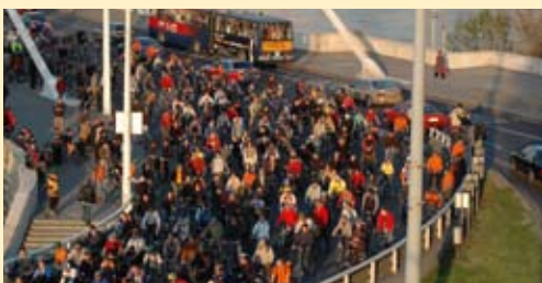
INTERREG projektas „ChangeLAB“ skatina tokią aplinką tausojančią naudojimą, kad neblogėtų gyvenimo kokybė ir nebūtų kliūčių gerovei didinti

Tai kas gi laukia naujuoju 2007–2013 m. biudžeto laikotarpiu? Tarpregioninis bendradarbiavimas ir toliau bus plėtojamas pagal INTERREG IVC programą. Pagal šią programą vykdoma veikla pirmiausia remsis IIIC programos, kurios kai kurie aspektai buvo išlaikyti, laimėjimais, taip pat bus siūloma naujų prioritetų ir naujų strategijų.