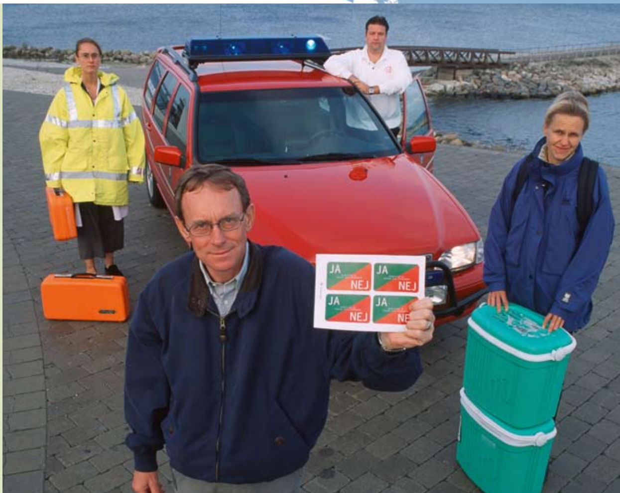
Kooperazzjoni ghal donazzjoni ta' l-organi bejn id-Danimarka u l-Isvezja.

tal-fruntiera (Savoie fi Franza), fit-tielet Rapport dwar il-koeżjoni soċjali u ekonomika ta' l-2004 ippropona strument legali ġdid fil-forma ta' struttura ta' kooperazzjoni Ewropea. L-abbozz ta' Regolament imbagħad ifforma parti mill-pakkett leġislattiv għall-perjodu ta' programmazzjoni 2007-2013 għall-Politika ta' Koeżjoni mġedda.