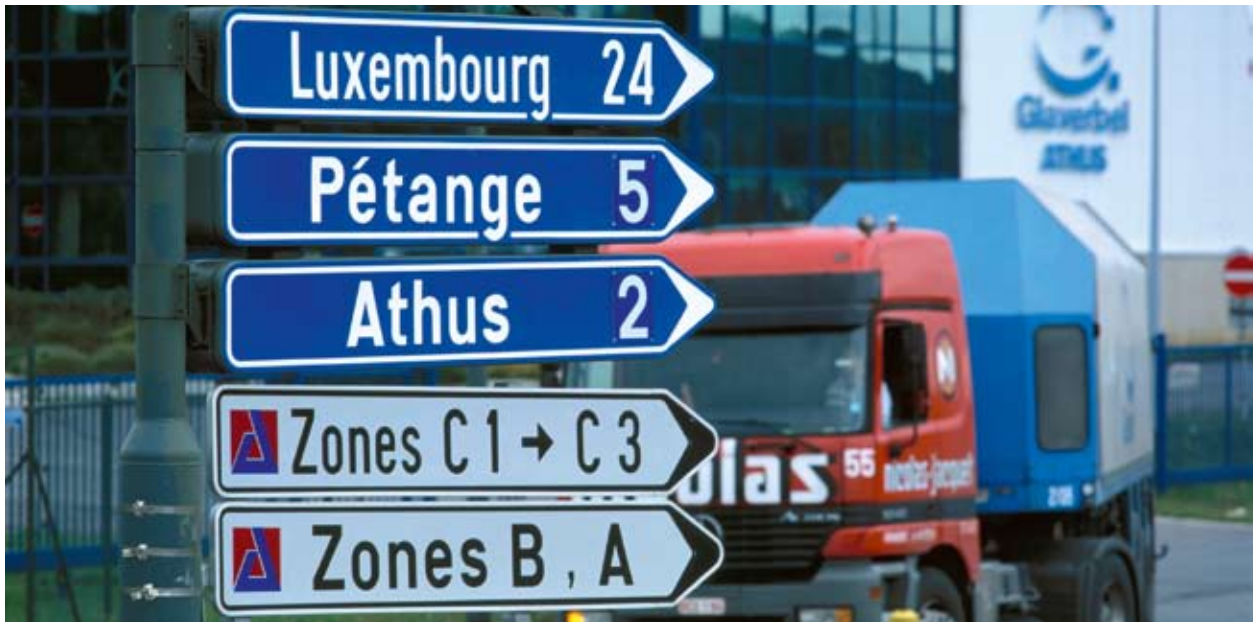
Rotta tat-trakkijiet traffikuża li taqsm il-fruntiera tal-Belġju, Franza u l-Lussemburgu.

Suq minn Brussell sal-Lussemburgu u kompli sa Strasburgu u tkun skużat jekk taħseb li m'għadhomx jeżistu fruntieri fl-UE. Iżda anki hawnhekk, fil-qalba ta' l-Ewropa, l-irwol ta' INTERREG jibqa' ta' importanza vitali sabiex tingħeleb l-influwenza tal-fruntieri u jinkiseb suq intern li jiffunzjona sewwa.