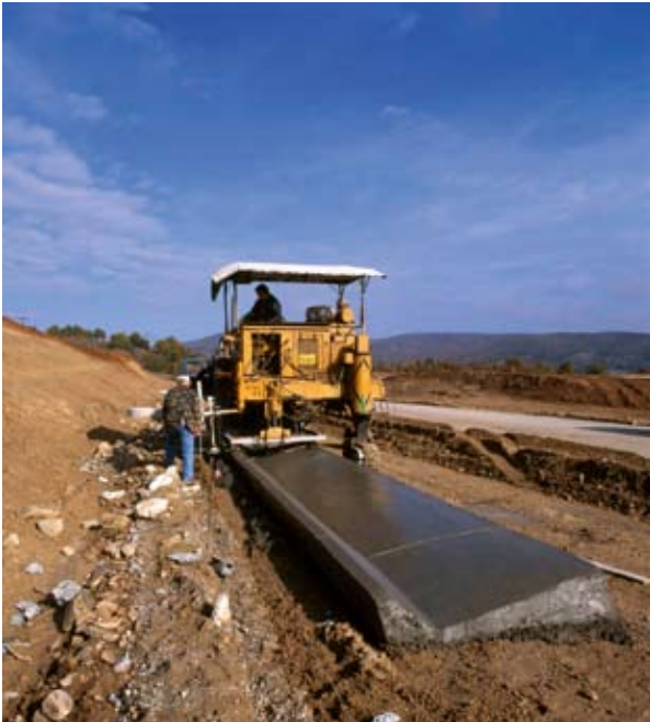
Il-bini ta' triq ġdida bejn il-Greċja u l-Bulgarija.