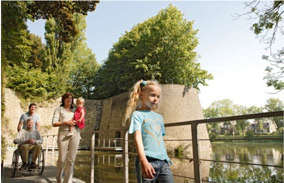
Turiżmu kulturali aċċessibbli għal kulhadd huwa prijorità għan-"Netwerk ta' Rhula Fortifikati".

Mijiet ta' sħubijiet fis-saħħa, il-kultura, it-teknoloġija, l-ambjent, iċ-ċittadinanza u aktar. Minn PACTE għal INTERREG IV, il-kooperazzjoni transkonfinali Franciża-Belġjana sejra tajjeb ħafna tassew.