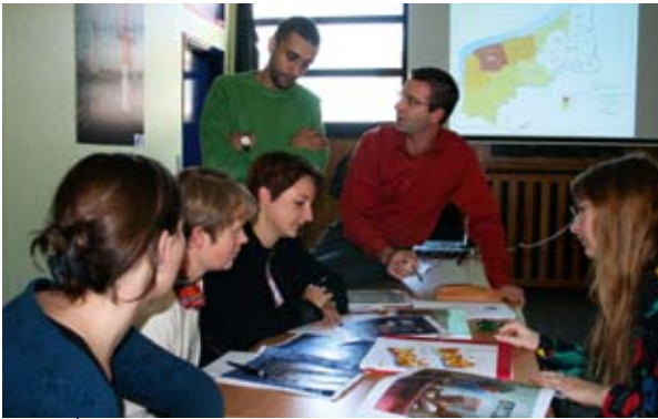
Il-Proġett "GoGIS": ġenerazzjoni ta' Sistema ta' Infurmazzjoni Ġeografika transkonfinali.