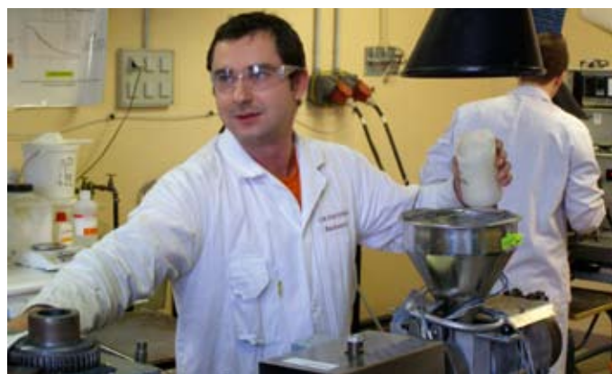
Het "Mabiolac"-project werkt aan de productie van biologisch afbreekbare materialen uit melkzuur.