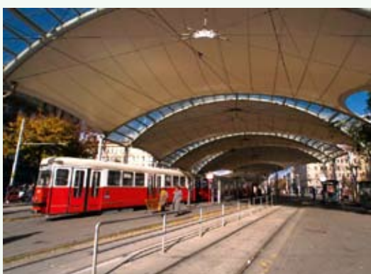
URBAN-vernieuwing in Wenen, Oostenrijk