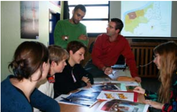
"GoGIS"-project: de uitbouw van een grensoverschrijdend geografisch informatiesysteem

Er lopen flink wat projecten onder Interreg IV – de beide musea zijn er klaar voor om samen te werken met nieuwe partners, waaronder zeker ook grote namen: er worden links gelegd met het Louvre, dat vanaf 2008 een afdeling in Lens opent, en het Museum Dr. Guislain in Gent, dat zich specialiseert in outsiderkunst. Er zitten nog tal van ideeën in de pijp: het kunstshuttle -project (vervoer per bus tussen Gent, Rijsel, Hornu, Lens, enz.), het museumtuin-project (zomeractiviteiten die zich richten tot gezinnen), het delen van documenten in het bezit van de vier musea en zelfs een tentoonstelling in een voormalig douanekantoor.