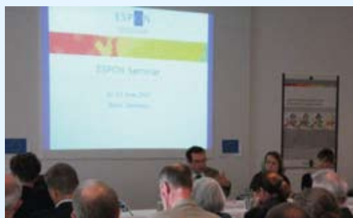
Een grote hoeveelheid nieuwe kennis over trends op het vlak van ruimtelijke ordening

Contact: info@espon.eu ( http://www.espon.eu/ )