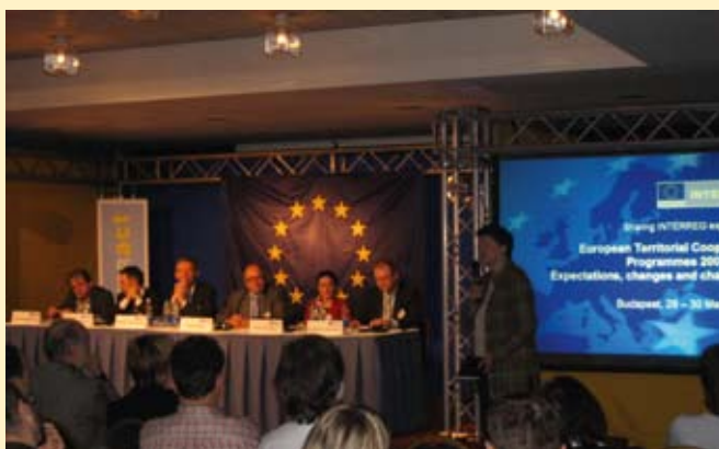
INTERACT-seminarie in Boedapest, Hongarije

Tijdens de nieuwe programmaperiode 2007-2013 zullen alle Europese territoriale samenwerkingsprogramma's nieuwe uitdagingen moeten aangaan en rekening moeten houden met het groeiende belang van de nationale wetgeving. De programma's zullen zich ook meer moeten focussen op de Lissabon- en Göteborgagenda's. Voor sommige domeinen staat men nog voor bijkomende uitdagingen als gevolg van de samenwerking met de nieuwe lidstaten en (potentiële) kandidaat-lidstaten.