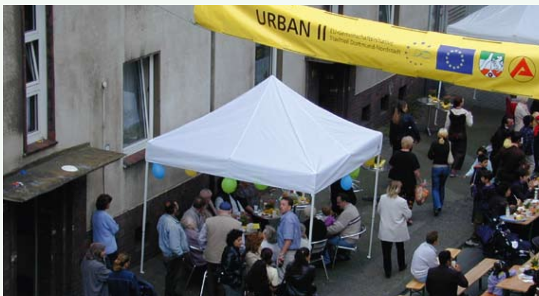
URBAN II-beurs in Dortmund-Nordstadt, Duitsland