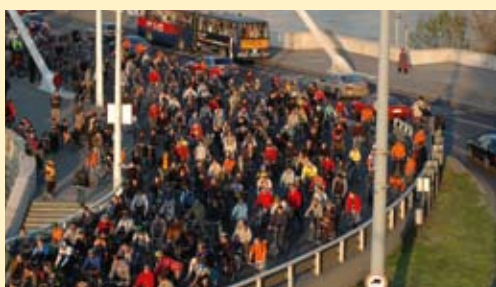
Het INTERREG "ChangeLAB"-project stimuleert milieuvriendelijke consumptiepatronen zonder aan de levenskwaliteit en de welvaart te raken.

Wat mogen we verwachten voor de volgende budgetperiode 2007-2013? De interregionale samenwerking zal verder ontwikkeld worden onder het Interreg IVC-programma. Het bouwt voort op het succes van het IIIC-programma, waarvan bepaalde aspecten behouden blijven, terwijl er ook nieuwe prioriteiten en benaderingen doorgevoerd werden.