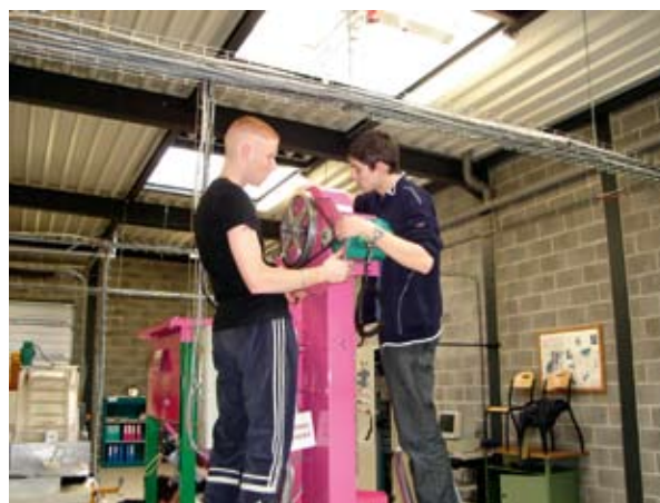
"Mini-Ulsines", een grensoverschrijdend opleidingsprogramma

"In de loop der jaren en op het ritme van de verschillende fasen van Interreg zijn we geëvolueerd van akkoorden rond specifieke aandoeningen (AIDS, nierfalen, enz.) naar het opzetten van een structuur die de toegang tot georganiseerde gezondheidszorg moet garanderen, ik denk dan aan voorbeelden als TRANSCARDS, de ZOASTs en de spoeddiensten. We hebben nu de intentie om te zorgen voor een volledig aanbod van grensoverschrijdende gezondheidszorgen voor iedereen in de regio. Dankzij Interreg en de Europese regelgeving, die dergelijke overeenkomsten stimuleert, is dit zeker geen onrealistisch doel."