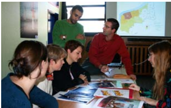
Proiectul "GoGIS": generarea unui sistem de informații geografice transfrontalier.

Nu există lipsă de proiecte la INTERREG IV — cele două muzee sunt gata să lucreze cu noi parteneri, dintre care unii destul de importanți: formează legături cu Louvre, care va avea o reprezentanță la Lens începând din 2008, și cu Muzeul Dr. Guislain din Ghent, care este specializat în artă brută. Printre ideile în pregătire se numără proiectul Navettes de l'Art (transport cu vagoane de pasageri între Ghent, Lille, Hornu, Lens, etc), proiectul Musées jardins (activități de vară îndreptate spre familii), reunirea documentelor deținute de cele patru muzee și chiar o expoziție — într-un fost sediu vamal.