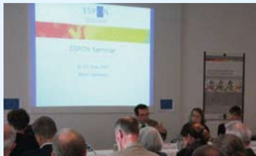
Cunoștințe noi substanțiale despre tendințele de dezvoltare spațială.

Autoritatea de gestionare: Ministerul Afacerilor Interne și Dezvoltării Spațiale din Luxemburg