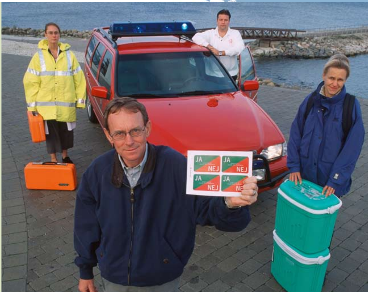
Cooperarea pentru donarea de organe între Danemarca și Suedia.

există. De aceea comisarul Barnier, care vine el însuși dintr-o regiune de frontieră (Savoia în Franța), a propus în Al 3-lea raport privind coeziunea economică și socială din 2004 un nou instrument legal sub forma unei structuri de cooperare europeană. Proiectul de regulament a făcut apoi parte din pachetul legislativ pentru perioada de programare 2007-2013 pentru Politica de Coeziune reînnoită.