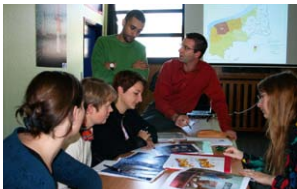
Projekt „GoGIS”: vytváranie cezhraničného Geografického informačného systému.

S programom INTERREG IV neexistuje nedostatok projektov – obe múzeá sú pripravené spolupracovať s novými partnermi, a k tomu ešte s dosť významnými: Nadväzujú vzťahy s Louvrom, ktorý bude mať od roku 2008 pobočku v Lens, a Múzeom Dr. Guislana v Ghente, ktoré sa špecializuje na art brut. Nápady na sklade zahŕňajú projekt Navettes de l'Art (autobusová doprava medzi mestami Ghent, Lille, Hornu, Lens, atď.), projekt Musées jardins (letné aktivity zamerané na rodiny), zdieľanie dokumentov v držbe štyroch múzeí a dokonca a výstava – v bývalej colnici.