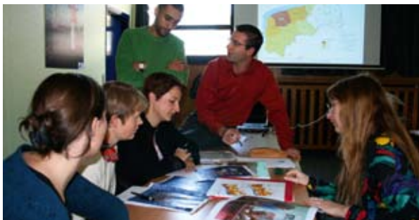
Projektet GoGIS: bygga upp ett gränsöverskridande geografiskt informationssystem.

För Interreg IV råder ingen brist på projekt. De två muséerna står redo att arbeta med nya partners – och dessutom riktigt stora sådana. De har knutit kontakt med Louvren, som med början 2008 kommer att ha en filial i Lens, och Dr. Guislain-muséet i Gent, som är specialiserat på art brut . Bland idéer som håller på att ta form finns projektet Navettes de l'Art (busstransporter mellan Gent, Lille, Hornu, Lens m.fl.) och projektet Musées jardins (sommарverksamhet inriktad på familjer), att sammanföra dokumentation hos de fyra muséerna och till och med en utställning – i ett före detta tullhus.