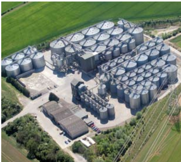
Camgrain, kumpanija li tahžen il-qamh li hija proprjetà ta' bdiewa, ser tnaqqas l-emissjonijiet tagħha ta' karbonju b'1000 tonnallata fis-sena.

ghat-tnaqqis tad-dijossidu karboniku, u kunfidenti mill-hiliet reġjonali li jeżistu sabiex jappoġġjaw l-iżviluppi f'dan il-kamp, il-mira li tinkiseb ekonomija li ma tantx tipproduci dijossidu karboniku f'dan ir-reġjun tgawdi appoġġ wiesa'.