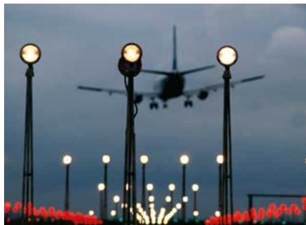
L-avjazzjoni hija wahda mis-sorsi li qed jiżdedu l-aktar fir-rigward tan-niġġis u l-emissjoni ta' karbonju.

L-ispejjeż ekonomiċi ta' l-effetti tat-tibdil fil-klima (eż. l-ispejjeż tan-nuqqas ta' azzjoni) qegħdin jgħinu dejjem aktar biex jinfurmaw id-dibattitu dwar politika. Dan huwa importanti biex jiġu żviluppati risposti ta' adattament adegwati bħala mezz kif jiġu limitati d-danni jew jiġu realizzati opportunitajiet assoċjati mat-tibdil fil-klima. L-ispejjeż ekonomiċi jipprovdu metru komuni ta' kejl u monitoraġġ tul is-setturi u jistgħu jgħinu biex jidentifikaw oqsma prinċipali ta' tħassib. Hemm ukoll bżonn ta' perspettiva ekonomika fil-linji politiċi ta' adattament Ewropej u nazzjonali sabiex