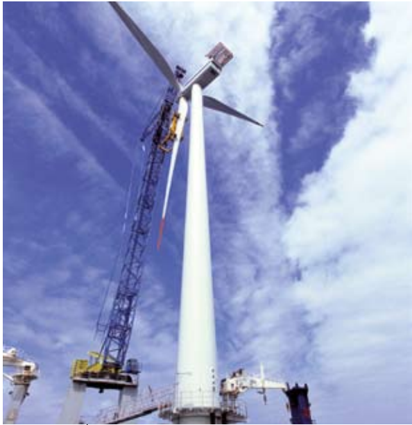
L -installazzjoni ta' turbina tar-rih offshore.

6 GW ta' kapaċità offshore mir-rih hija pplanata hemmhekk matul it-tmien snin li ġejjin. Il-portijiet ta' Lowestoft u Great Yarmouth huma fiċ-ċentru ta' dawn l-iżviluppi. Iż-żewġ portijiet intużaw matul il-kostruzzjoni tal-Wind Farm 'il barra mix-xtut ta' Scroby Sands, li hija waħda mill-ewwel wind farms kummerċjali 'l barra mix-xtut fir-Renju Unit. Scroby Sands tiġġenera biżżejjed enerġija biex tforni 'l fuq minn 36 000 dar, u b'hekk tiffranka 'l fuq minn 65 000 tunnellata ta' emissjonijiet ta' diossidu karboniku.