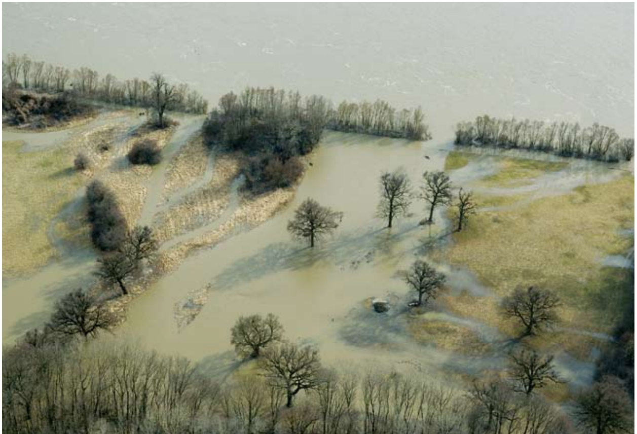
L-ghargħar huwa l-ewwel effett viżibbli tal-bidla fil-klima.

Huwa kruċjali għall-Ewropej li jiġu implimentati miżuri f'waqthom, adegwati u effiċjenti sabiex jevitaw jew inaqqsu l-ħsara potenzjali tat-tibdil fil-klima għas-sistemi umani u ekoloġiċi.