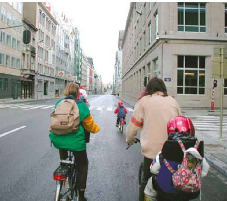
Jum mingħajr karrozzi fi Brussell, il-Belġju.

Fit-22 ta' Ottubru 2007, il-Kummissjoni Ewropea adottat l-ewwel rapport tal-progress tagħha dwar l-SDS 2 . Għalkemm il-progress f'dan il-qasam għadu modest, l-iżviluppi fil-linji politiċi Ewropej u nazzjonali huma aktar inkoraġġanti, b'mod partikolari fil-qasam ta' l-enerġija u t-tibdil fil-klima. Il-politika ġdida integrata li għet adottata mill-Kunsill f'Marzu 2007 tinkludi fost l-aktar miżuri importanti li ttiehdu fuq livell Ewropew. Kważi l-Istati Membri kollha adottaw strateġiji biex jikkumbattu t-tibdil fil-klima.