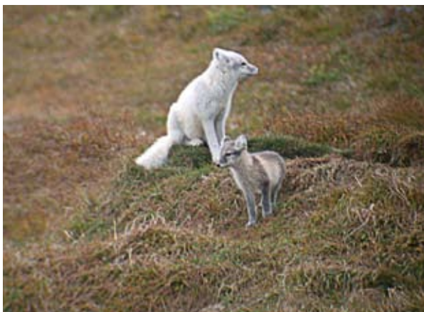
Lewn il-pil tal-lupu ta' l-arktiku diġà għe affettwat mill-bidla fil-klima.

Barra minn hekk, huma probabbli riskji akbar ta' nirien fin-nofsinar ta' l-Ewropa. Ir-reġjuni muntanjużi, bhall-Alpi, huma partikolarment vulnerabbli għat-tibdil fil-klima u diġà qegħdin isofru minn żidiet oġġla mill-medja fit-temperatura, fejn il-glacieri u l-permafrost li jinhallu huma probabbli li jikkawżaw żieda fil-perikli naturali, fl-erożjoni tal-ħamrija u fl-ghargħar. L-Awstrija diġà qiegħda tevalwa dawn ir-riskji u l-effetti avversi relatati fuq it-turiżmu tax-xitwa, billi qiegħda tassessja l-vulnerabilità tagħha għall-impatti tat-tibdil fil-klima u qiegħda tfassal azzjonijiet possibbli sabiex tadatta fil-ħin biex tnaqqas l-ispejjeż soċjali. It-tibdil fil-klima jista' jkollu effetti kbar fuq iż-żoni kostali minħabba ż-żieda fil-livell tal-baħar u l-bidliet fil-frekwenza u/jew il-qawwa tal-maltempati. L-Olanda, flimkien ma' partijiet interessati mis-setturi differenti, qiegħda tiżviluppa pjani biex tnaqqas ir-riskji minn ghargħar kostali u tax-xmajjar. L-ambjenti naturali u l-ekosistemi kostali fuq il-baħar Baltiku, Mediterran u Iswed b'mod partikolari qegħdin f'riskju għoli b'telf konsiderevoli ta' artijiet mistagħdra.