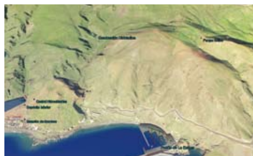
Veduta tas-sistema shiha.

Għal aktar tagħrif, jekk jogħġbok żur: itc@itccanarias.org