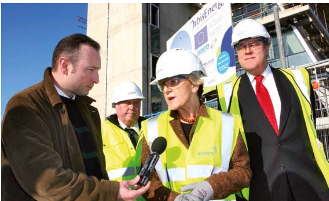
Il-Kummissarju Danuta Hübner waqt li żżur is-sit ta' kostruzzjoni ta' OrbisEnergy f'Jannar 2008.

Il-Lvant ta' l-Ingilterra huwa wiehed mill-ftit reġjuni Ewropej li aktarx jilhaq il-miri ġodda u ambizzjużi għat-tnaqqis tal-karbonju fl-UE li ġew stabbiliti mill-Kummissjoni Ewropea fil-pakkett ta' proposti riċenti tagħha biex tiġġieled it-tibdil fil-klima u tippromwovi l-enerġija sostenibbli. Huwa wkoll l-uniku reġjun li għandu programm apposta għalih ta' €110 miljun mill-ERDF li se jgħin biex jitnaqqsu l-emissjonijiet tal-CO 2 u jżid it-tkabbir ekonomiku.