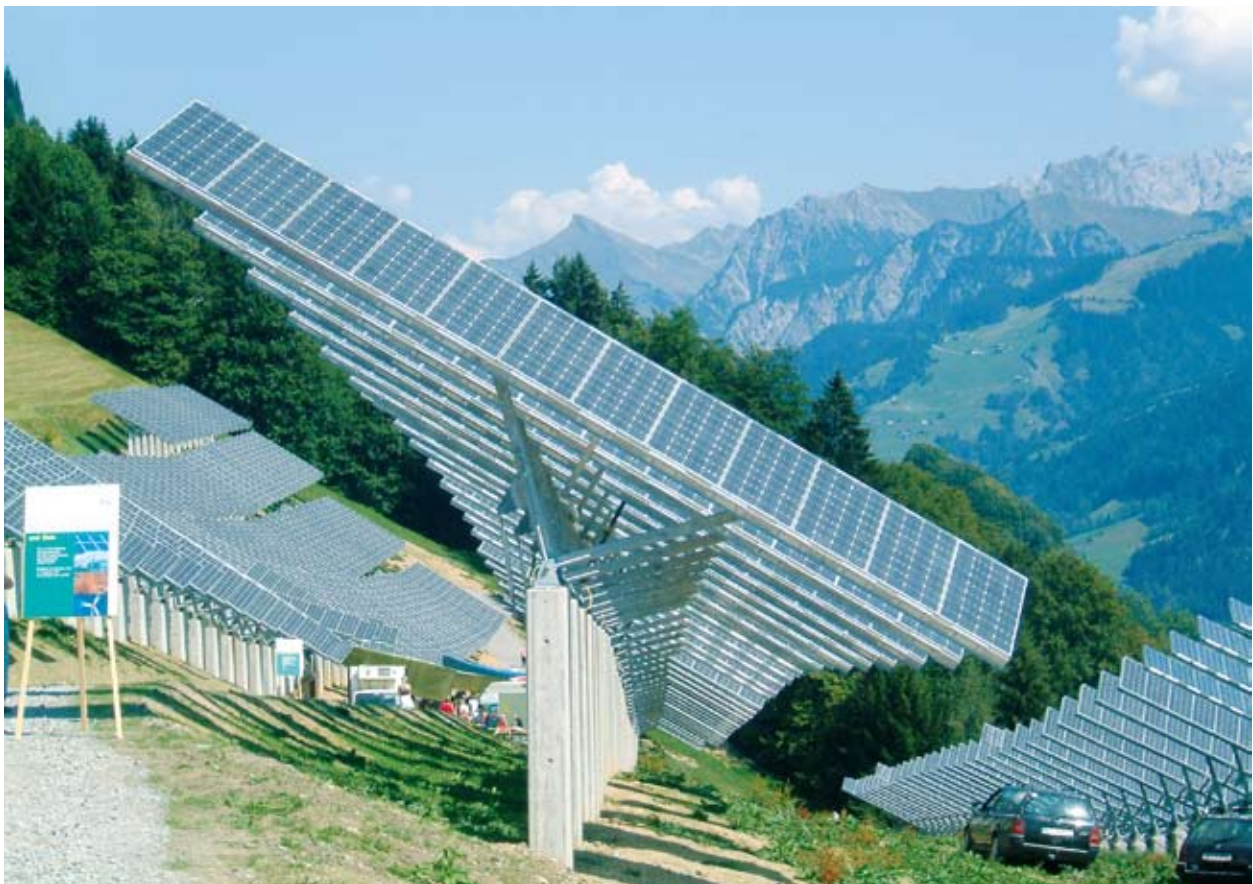
Sistema kbira fotovoltajka tipproduċi 530 MWh mill-enerġija mix-xemx fi Blons, l-Awstrija.

It-tibdil fil-klima – u l-impatt tiegħu fuq il-mod kif nikkunsmaw u nipproduċu – huwa dejjem aktar fiċ-ċentru tal-politika dwar l-iżvilupp sostenibbli. Għalhekk, huwa ċentrali għall-iżvilupp reġjonali, billi jippreżenta sfida li m'għandhiex preċedenti, iżda huwa wkoll opportunità għar-reġjuni Ewropej f'dak li għandu x'jaqsam mal-kapaċità tagħhom li jgħedd u joħolqu impjiegi godda.