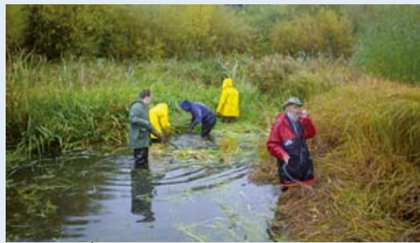
Huwa fl-interess ta' kullhadd li niehdu hsieb l-ekosistemi.

Artikolu 1 tar-Regolament dwar il-Fond ta' Koeżjoni jerga' jiddikjara li l-Fond ġie maħluq b'riżultat tax-xewqa li tissaħħah il-koeżjoni ekonomika u soċjali bl-iskop ta' żvilupp sostenibbli filwaqt li l-Artikolu 2 jissottolinja l-enfasi għal tal-Fond fuq l-iżvilupp sostenibbli filwaqt li jiddikjara l-eligibilità għall-"effiċjenza ta' l-enerġija u l-enerġija li tiġġeddu".