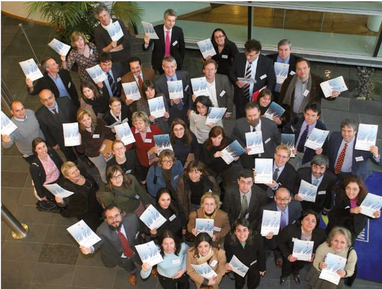
Parteċipanti f'seminar f'Exeter, l-Ingilterra, fl-2006.

In-netwerk ta' "Programmi għall-Integrazzjoni Ambjentali fl-Iżvilupp Reġjonali (GRDP)" żviluppa prodotti biex jgħinu lill-entitajiet pubbliċi jagħtu importanza sħiħa lill-kwistjonijiet ambjentali fl-iżvilupp lokali u reġjonali.