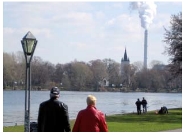
L-iżvilupp u l-implimentazzjoni ta' miżuri ta' adattament huma kwistjoni relattivament ġdida.

L-ewwel pass huwa li jiġu żviluppati u implimentati azzjonijiet dwar it-tibdil fil-klima fl-istrateġiji u l-linji politiċi eżistenti. Per eżempju, biex jittejjbu d-disponibilità u l-kwalità ta' l-ilma u jitnaqqsu l-effetti ta' l-għargħar, element bażiku huwa d-Direttiva ta' Qafas dwar l-Ilma bl-approċċ gradwali u ċikliku tagħha. Huwa importanti li l-Istati Membri ta' l-UE issa qegħdin jieħdu passi biex jiddiskutu kif jiżguraw li t-tibdil fil-klima jkun inkorporat fil-pjani għall-immaniġġar tal-baċini tax-xmajjar diġà mill-ewwel ċiklu li jibda fl-2009. Hemm konnessjonijiet importanti li jridu jsiru fil-każ ta' l-ippjanar spazjali, billi huwa meħtieġ involviment qawwi tal-partijiet interessati sabiex l-adattament ikun aċċettat u jirnexxi. Partijiet interessati importanti jinkludu l-awtoritajiet subnazzjonali u lokali, in-negozji u ċ-ċittadini. B'mod partikolari dawk li jippjanaw l-ispażji għandhom jaħdmu fi hdan il-kwadri korrispondenti sabiex jassiguraw li t-tibdil fil-klima jiġi inkluz billi huma qegħdin jitttrattaw diversi livelli ta' ippjanar u jistgħu jintegraw u jmxexxu fuq l-evalwazzjoni tal-kapaċità ta' adattament.