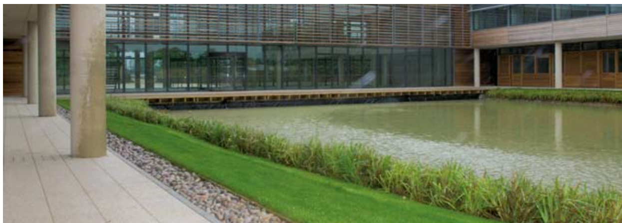
L-"Innovation and Business Base" f'Luton.

SmartLIFE (Smart Lifestyle Innovations for our Environment), kien proġett pilota internazzjonali mmexxi mill-Kunsill tal-Kontea ta' Cambridgeshire, bi shubija mad-Dipartiment ta' l-Ambjent tal-Belt ta' Malmö fl-Isvezja u TuTech Innovation GmbH f'Hamburg, il-Ġermanja. L-attenzjoni prinċipali ta' SmartLIFE kienet fuq in-nuqqas ta' hiliel u kapacià fi hdan l-industrija tal-kostruzzjoni biex tipprovdi akkomodazzjoni ġdida li tkun kemm affordabbli kif ukoll ambjentalment sostenibbli. Il-proġett stabbilixxa numru ta' korsijiet ta' taħriġ u kwalifiki. Xi 2 500 apprendist għaddew miċ-ċentri mwaqqfa permezz ta' SmartLIFE. Il-proġett irċieva diversi premijiet ambjentali u ġie magħżul għall-Premijiet tad-DG RegioStars 2008.