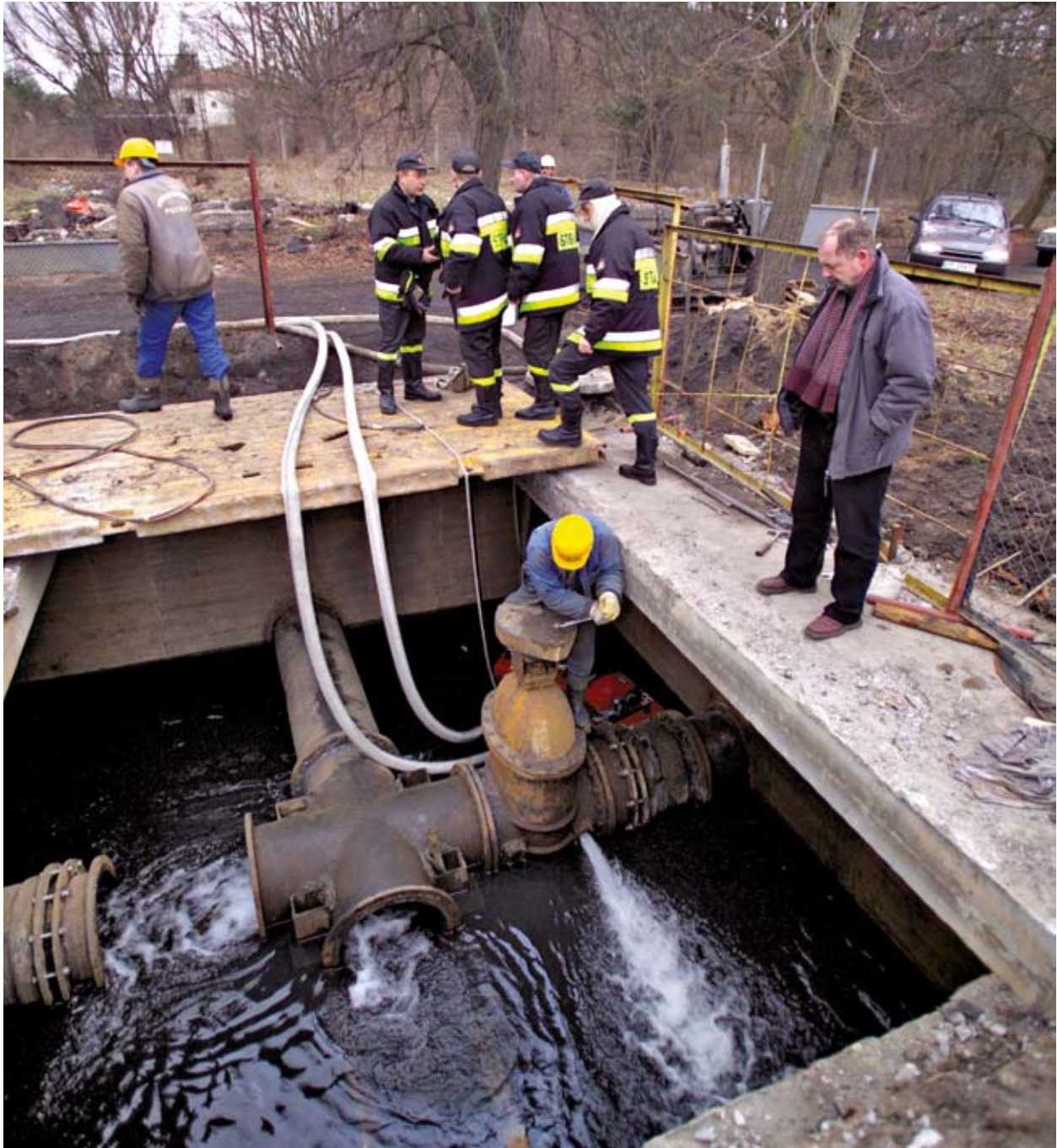
Installazzjoni ta' pompi għal bjar fondi fl-impjant il-ġdid tat-tisfija ta' l-ilma f'Dodrzyca, il-Polonja.

Il-Programm se jippermetti wkoll lill-Polonja ssegwi l-miri marbuta ma' l-emissjonijiet ta' gassijiet tas-serra, li ġew stabbiliti mill-Unjoni Ewropea fl-2007. Huwa ser jagħmel dan billi jsostni attivitajiet li jimmiraw sabiex iżidu l-effikaċja tas-settur ta' l-enerġija, billi jippromwovi enerġiji li jiġġeddu, billi jinvesti f'sistemi tat-trasport sostenibbli u, fejn ikun meħtieġ, billi jeżamina l-influwenza ta' attivitajiet partikolari fuq it-tnaqqis ta' l-emissjonijiet.