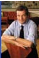
Dinamarca. Preguntas al Sr. Bendt Bendtsen, Ministro danés de Economía e Industria