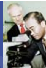
Ingllaterra: las agencias de desarrollo regional