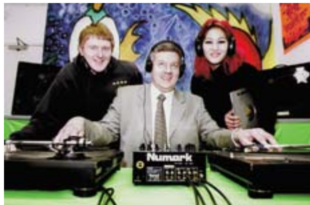
La «Casa del sonido», proyecto realizado por un centro artístico de Plymouth, recibe ayuda de la agencia de desarrollo regional del suroeste.

Entre los otros sectores de actividad de la agencia, se puede citar la aplicación de una estrategia regional de innovación destinada a desarrollar de manera coherente las tecnologías de la información en el territorio. La agencia apoya también una amplia gama de iniciativas europeas en el ámbito de la mejora de las competencias, desde la más básica a la más avanzada. En este contexto se subvencionan las formaciones profesionales impartidas por el observatorio regional del