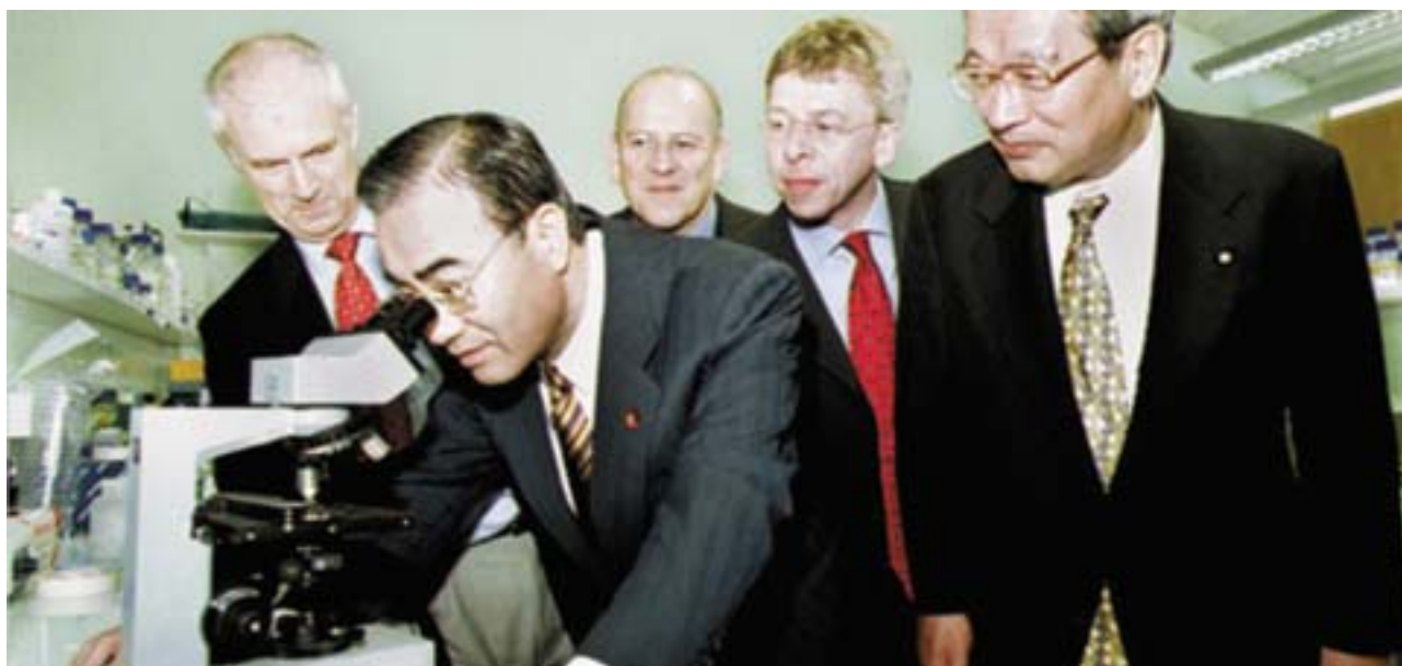
Diputados japoneses visitan el Tamar Science Park (noroeste de Inglaterra). Las agencias de desarrollo regional pretenden atraer a los inversores extranjeros.

De acuerdo con los ministros pertinentes (Educación y Empleo, Comercio e Industria), el Gobierno británico decidió aumentar sensiblemente la autonomía de las agencias, confiándoles una asignación presupuestaria global desde el ejercicio 2002-2003. Esto permite a las RDA realizar mejor sus prioridades regionales específicas, especialmente cuando las mismas no son tenidas en cuenta lo suficiente por los programas existentes.