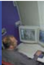
Flevoland: acompañar a la región más joven de Europa