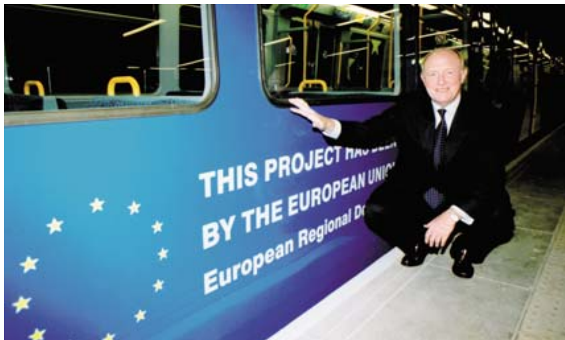
El comisario Neil Kinnock en la inauguración del metro de Sunderland, decorado con los colores europeos.

Esta contribución europea se ha puesto especialmente de relieve gracias al lanzamiento de una campaña de promoción europea y a que un metro pintado con los colores de la Unión circulará durante un año en la nueva línea (fotografía).