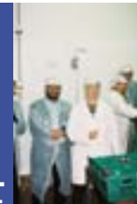
Netwin: una metodología para las redes locales de empresas