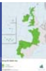
Atlantin alueen Interreg-ohjelma