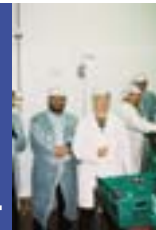
Netwin: Välineitä paikallisten yritysverkostojen luomiseksi ja kehittämiseksi