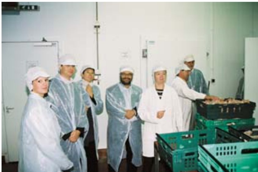
Netwin-kumppanit vierailulla irlantilaisessa Waldoan Food Limited -yrityksessä, joka on kymmenen muun maatalous- ja elintarvikealan pk-yrityksen kanssa perustanut Roscommon Food Network -paikallisverkoston.

Netwin-hankkeessa, joka toteutettiin kuudella eurooppalaisella alueella, seurattiin kolmen vuoden ajan 24:ää yritysverkostoa, joiden koko ja tavoitteet vaihtelivat suuresti. Näiden kokemusten tarkastelun perusteella luotiin valikoima välineitä ja menetelmiä, joita voidaan käyttää hyvin erilaisissa maantieteellisissä ja taloudellisissa yhteyksissä.