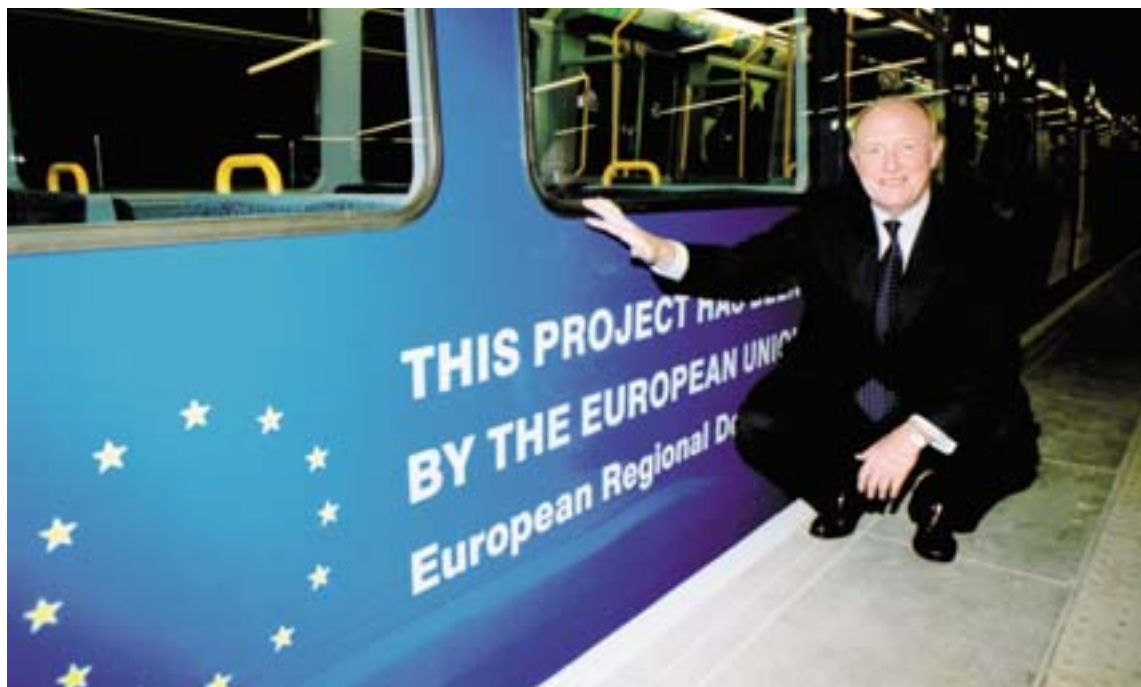
Kommissionär Neil Kinnock vid invigningen av tunnelbanan i Sunderland som pryts med de europeiska färgerna.

Det europeiska bidraget framhålls i allra högsta grad eftersom en europeisk kampanj har inletts och en tunnelbanevagn som har målats i unionsfärgerna kommer att gå på den nya linjen under ett år (bild).