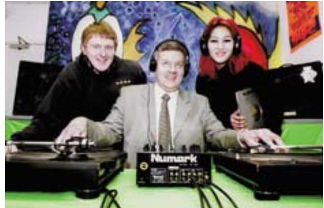
Soundhouse-projektet håller till i ett kontorshus i Plymouth och får stöd av Sydvästra kontoret för regional utveckling.

Genom det nyligen öppnade representationskontoret i Bryssel ämnar Sydvästra England stärka sin interna och externa image och etablera sig som en region att räkna med på den europeiska scenen.