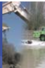
Het nieuwe Solidariteitsfonds van de Europese Unie