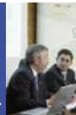
Andalusië en de strijd tegen de „digitale tweedeling“