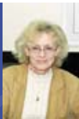
Slovenië: Succesverhaal — In gesprek met Tea Petrin, minister van Economische Zaken van Slovenië