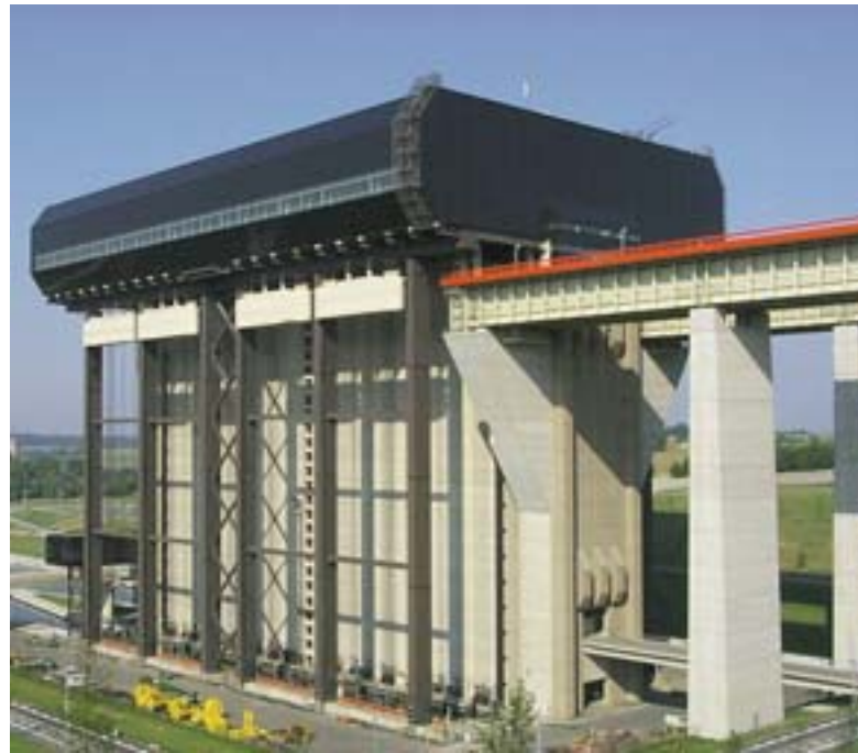
Met de schepenlift van Strépy-Thieu kunnen binnenvaartschepen een hoogteverschil van 88 m overbruggen.

Région Wallonne Ministère de l'Équipement et des transports Direction générale des voies hydrauliques de Mons (D 221) Rue Verte 11 B-7000 Mons Tel. (32-65) 39 96 10 Internet: http://voies-hydrauliques.wallonie.be (Canal du Centre): http://www.canal-du-centre.be