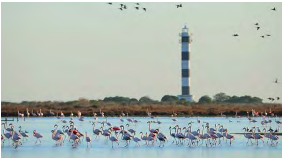
© Estació Nàutica Sant Carles de la Rapita

Ce contrat conforte la position et la réputation de l'AEIDL, en combinant expertise en communication et politique environnementale européenne. L'AEIDL a également su établir et maintenir le contact avec de nombreux experts dans toute l'Europe et dans de nombreux domaines liés à la protection de l'environnement, de la nature et de la biodiversité. L'expérience acquise avec LIFE démontre la capacité de l'AEIDL à produire une information de qualité. Elle sera valorisée pour d'autres domaines touchant l'environnement tels que le changement climatique, les énergies renouvelables et, plus généralement, le développement durable.