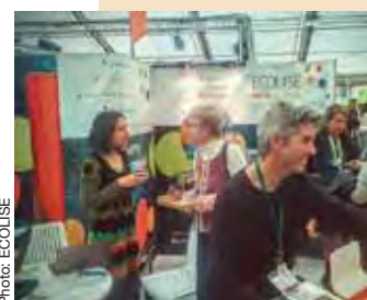
ECOLISE à la COP21 de Paris en décembre 2015.