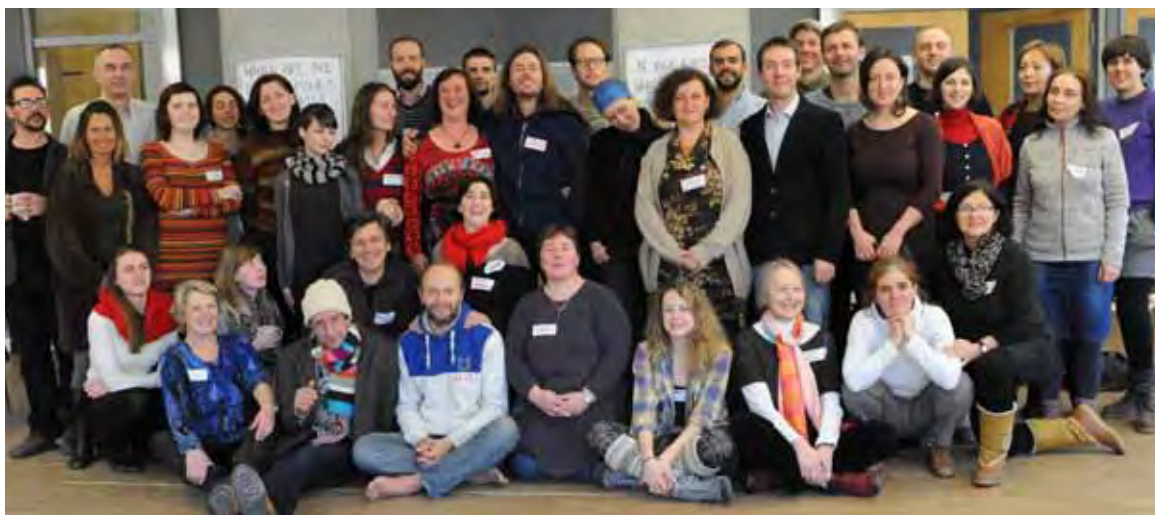
Assemblée générale d'ECOLISE, 6-8 février 2015.

ECOLISE est le résultat d'une étude menée par l'AEIDL en 2012/2013 dont le but était d'évaluer la situation de l'action locale en matière de changement climatique et de développement durable en Europe. L'étude a ainsi répertorié plus de 2 000 initiatives communautaires locales directement engagées dans des activités concernant ces deux domaines. Elle a également permis de réunir des acteurs-clés à travers toute l'Europe afin de débattre sur la création d'un réseau européen destiné à soutenir la coopération et l'échange entre ces initiatives.