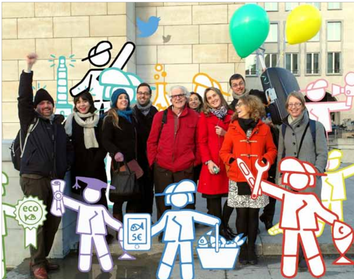
Membres de la Cellule d'appui FARNET à la conférence «Cap sur 2020» (Bruxelles, 2-3 mars 2015).

FARNET constitue une opportunité d'exploiter l'expérience territoriale rurale de LEADER de l'AEIDL dans une dimension nouvelle, ainsi que son expertise dans l'animation des programmes européens. L'AEIDL est associée à une initiative qui est en train de devenir un des éléments centraux de la politique européenne de la pêche dans les années à venir.