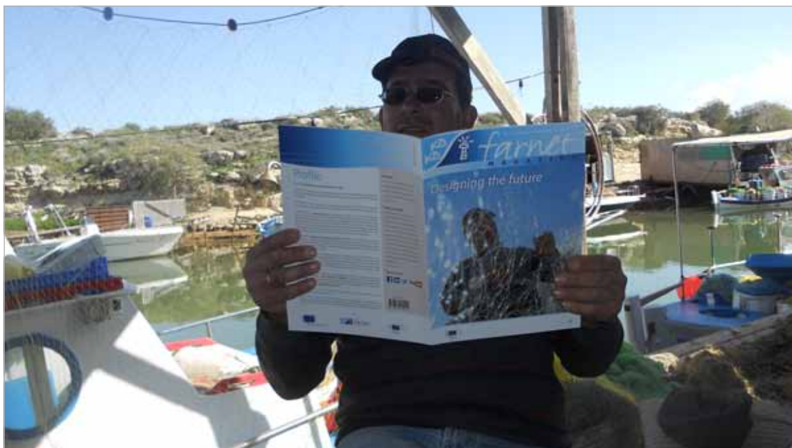
Pêcheur chypriote lisant FARNET Magazine .