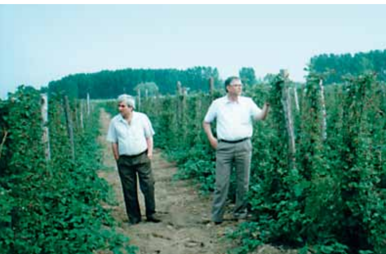
Man afventer den første hindbærhøst

der ejer de opdyrkede 10 ha, leveret planter, faglig bistand, kunstvandingssystem osv. (omkostninger: ca. 11600 ECU/ha). De deltagende producenter (lejemål for 15 år; det samlede "lejebeløb" svarer til udgifterne for kommunen) vedligeholder så til gengæld kommunens arealer (afstudsning, lugning osv.) og høster de værdifulde røde frugter til egen fortjeneste. Kommunen har anvendt den samme strategi i alle sine projekter. I nærheden af landsbyen har man f.eks. omdannet en tidligere mose til kunstig sø. Der er rejst et imponerende antal bygninger og installationer: et kultur- og fritidscenter, svømmebassin, hotel med 15 værelser, cafeteria, legeplads osv. Der er desuden konstrueret 34 sociale boliger omkring søen, en bondegård er omdannet til en visningsgård til undervisningsformål og hestecenter. Man planlægger endvidere at etablere en marina. Driften af de fælles anlæg i dette meget nye bygningskompleks varetages i øjeblikket af medarbejdere fra kommunen og af frivillige, men på længere sigt er det hensigten at overlade driften til private.