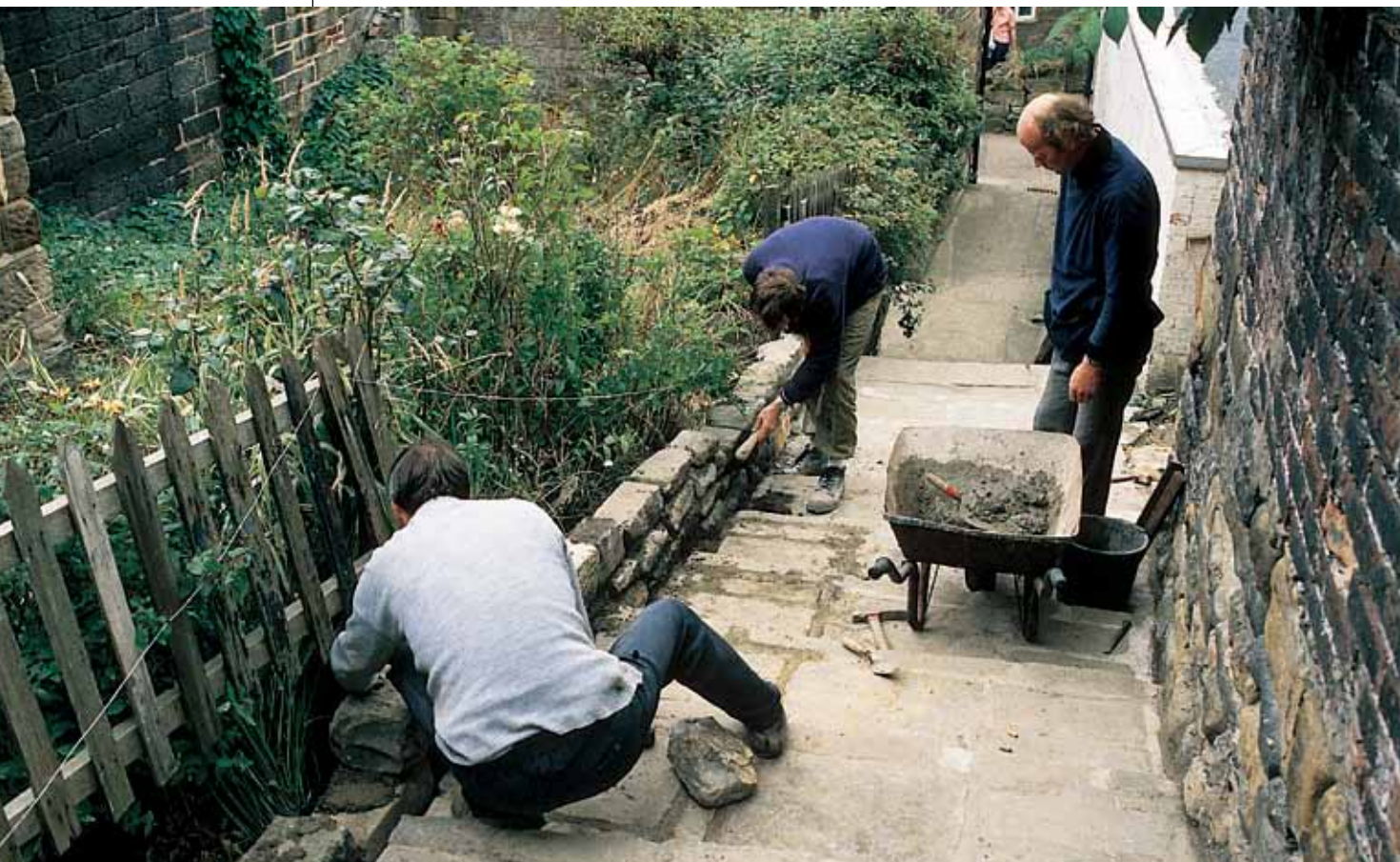
Renoveringsarbejde med støtte fra North York Moors National Park

Partnerskabet har som forberedelse til denne strategi oprettet en LEADER-enhed for faglig bistand, som blandt andet har deltagelse af de forskellige lokale og regionale myndigheder og eksperter fra den nationale parktjeneste (den afholder lokale udviklingsaktioner inden for sit område).