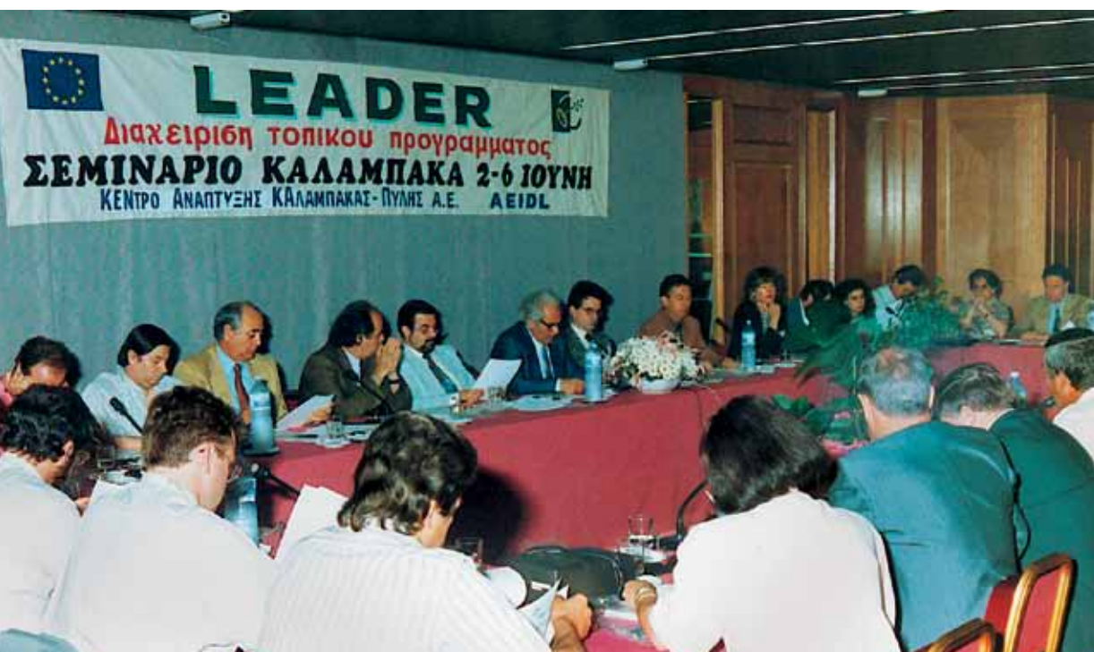
Erfarings- udveksling: LEADER-seminar i Kalabaka [Grækenland]