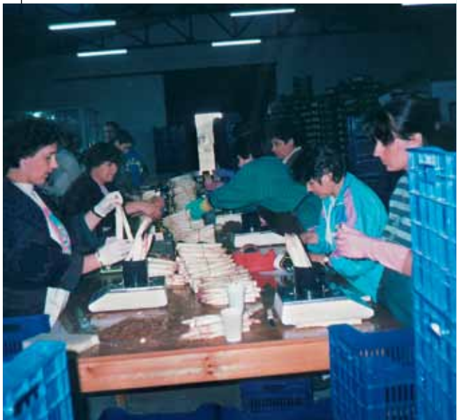
Indpakning af asparges ved kooperativet i Tychero

Trakien har i nogle år, både for EU og for den græske regering, været et højt prioriteret interventionsområde, hvor virksomheder har kunnet opnå støtte til investeringer på op til 50% af omkostningerne. Omvæltningerne inden for international politik i denne del af verden har også påvirket den lokale befolknings-sammen-sætning. tusindvis af grækere, som har boet i Rusland eller i Georgien, slår sig i stigende grad ned i fødrelandet igen, og de græske myndigheder har givet mange incitament til at slå sig ned i Trakien, og det har modvirket den truende udvandring fra regionens land-distrikter. "De hjemvendte er en saltvandsindsprøjtning for området", siger Tycheros borgmester. "De er en af de vigtigste målgrupper for vores aktion. De 14 husstande, der har haft glæde af "operation hindbær", blev udvalgt i forbindelse med uddelingen af koncessionsrettigheder, der desuden omfattede familier uden jord og unge ledige, som ønskede at blive i hjemegnen." De samme erhvervsdrivende er også berørt af to andre aktioner, som Tychero kommune har afholdt. Det drejer sig om oprettelsen af et væverikooperativ med 115 kvinder, hvoraf mange er hjemvendte grækere, og konstruktion af nye sociale boliger. "Vores målsætning er at konstruere 130 boliger", anfører Christos Hatzopoulos, "ikke blot for de hjemvendte, men også for de unge familier. Mit største ønske er at kunne fordoble befolkningstallet i kommunen i løbet af få år."