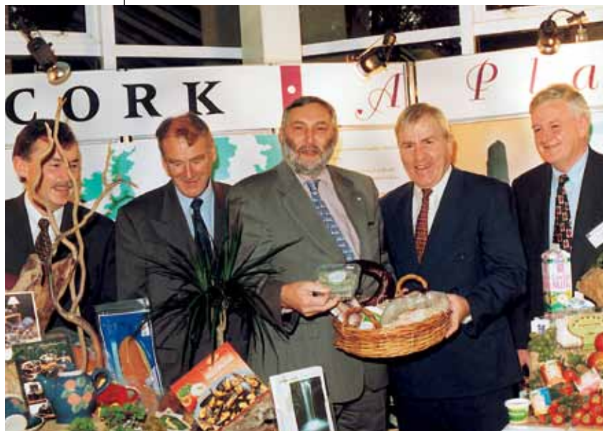
El Comisario Franz Fischler y el Sr. Jimmy Deenihan, Secretario de Estado irlandés encargado del desarrollo rural, recibidos por los miembros del grupo LEADER West Cork

Por último, cabe destacar que unos veinte grupos LEADER, situados en Irlanda y en el Reino Unido, aprovecharon la conferencia de Cork para reunirse y reflexionar sobre los medios que podían poner en marcha para intensificar la dimensión local y "ascendente" de sus programas y para emprender cooperaciones relacionadas con este tema (ya se ha previsto organizar un seminario que "reúna a las dos islas" para el primer trimestre de 1997). <