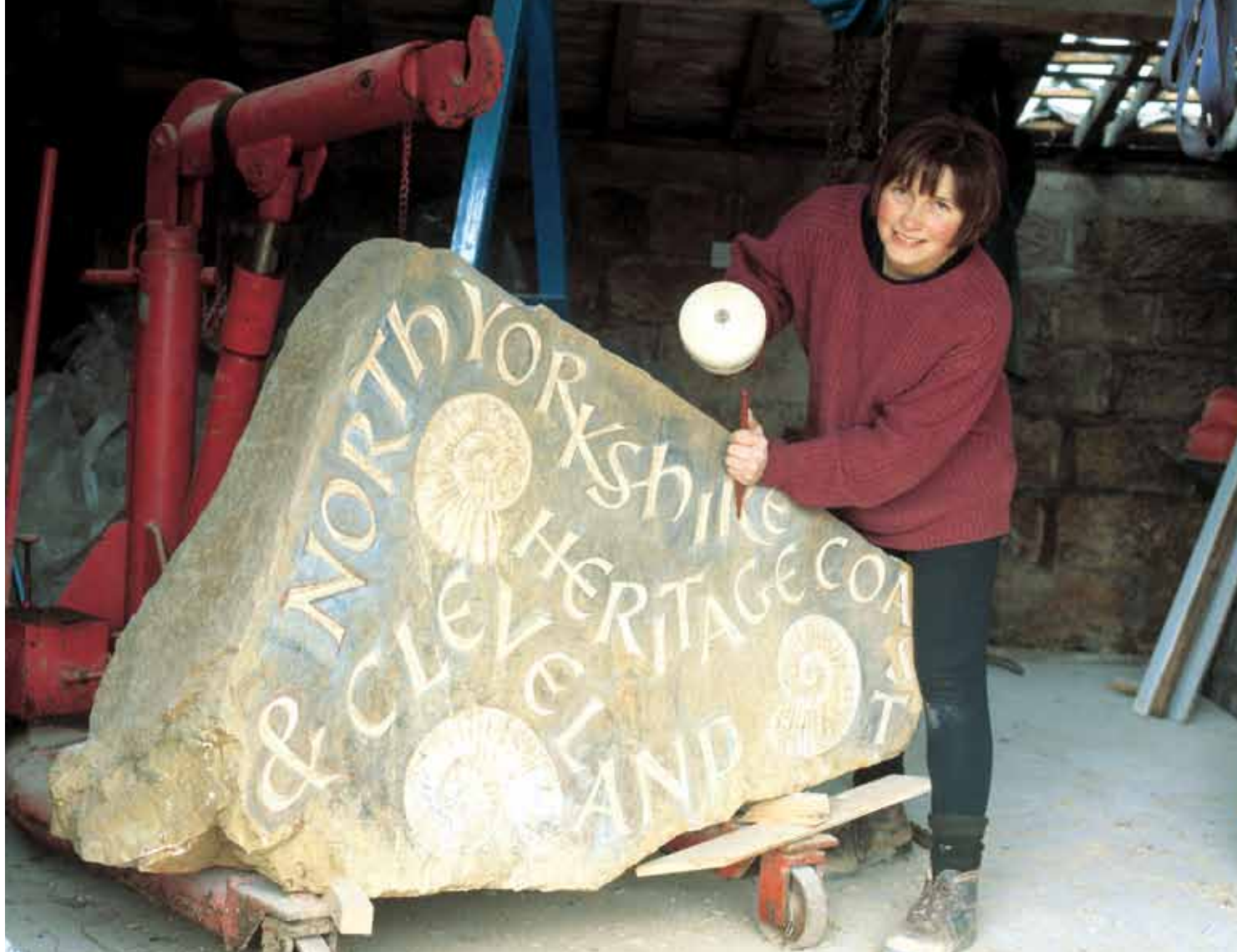
Esculpiendo un indicador de la "Costa del Patrimonio"