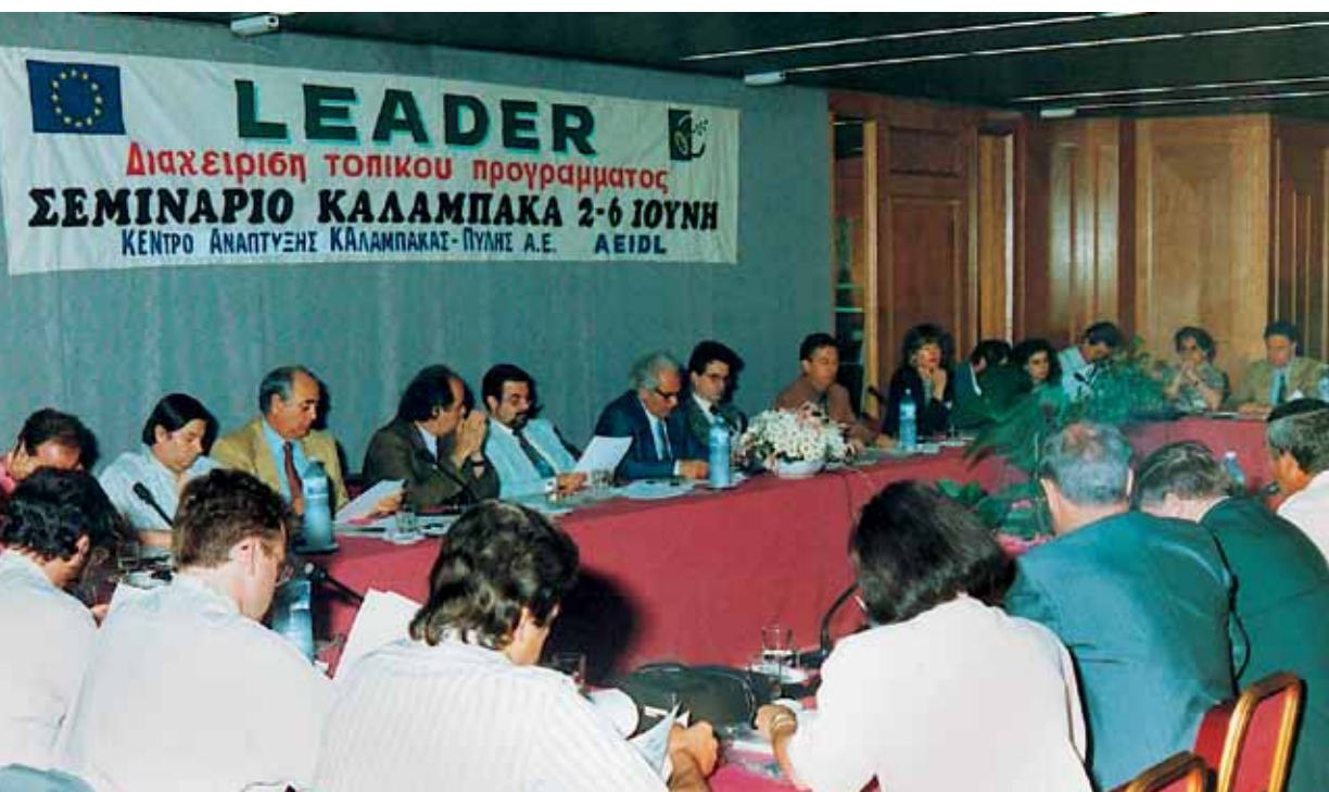
Compartir experiencias: seminario LEADER en Kalabaka [Grecia]