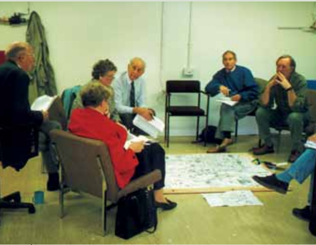
Un mapa facilita la identificación de las necesidades locales [reunión del comité LEADER de Whitby, NYHC]

Como útil democrático al servicio del desarrollo, los “village appraisals” (“auditorías locales”) o “community appraisals” (“auditorías territoriales”) constituyen un medio excelente para movilizar a la población local, para identificar las fuerzas, los puntos débiles, las necesidades del territorio, y, consecuentemente, para elaborar proyectos conjuntamente. Tal es su éxito que, aunque concebido originalmente para el medio rural, este tipo de acción se aplica cada vez más a zonas urbanas.