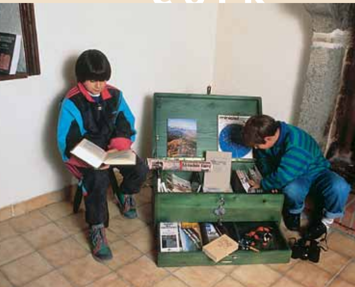
"El cofre del tesoro" con prismáticos, brújula, guías, etc. que permitirá a los visitantes de los alojamientos rurales descubrir el Parque Natural de Livradois-Forez [Francia]