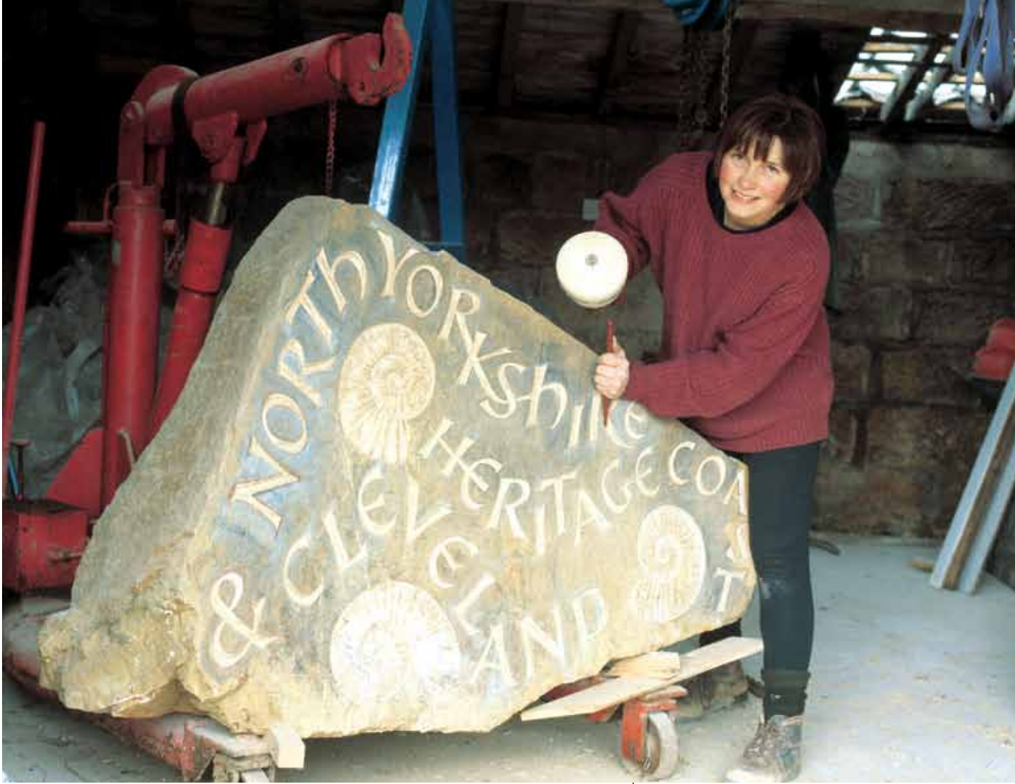
“Kansanperintörannikon” opaskiveä veistetään