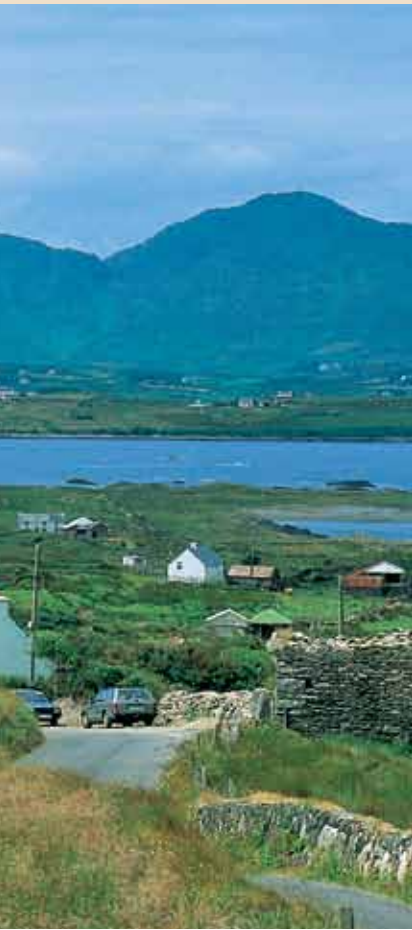
Bearan niemimaa [West Corkin LEADER-alue]