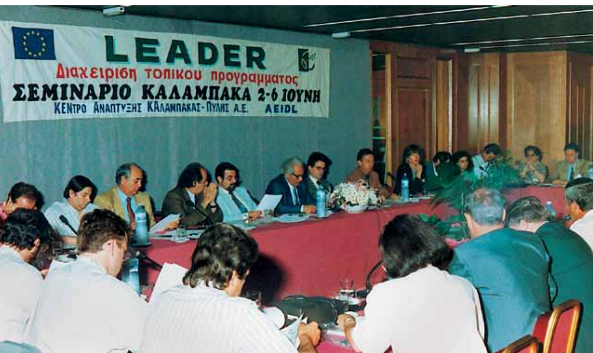
Kokemusten vaihtoa: LEADER-seminaari Kalabakassa [Kreikka]