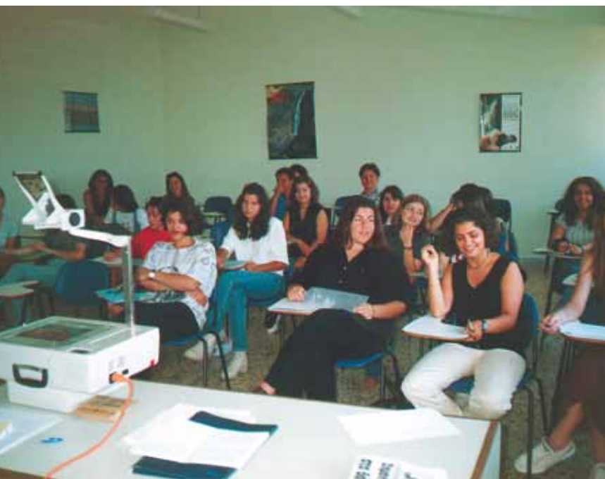
Een van de vele opleidingssessies die de lokale actiegroep organiseert

Het dorpje Feres (6 000 inwoners) krijgt nu een park rond een oud aquaduct, dat 9 000 bezoekers per jaar trekt. Met steun van LEADER I werden paden aangelegd en werden er een amfitheater en een café gebouwd, geleid door de vrouwencoöperatie "Ekavi". De 34 leden (echtgenotes van landbouwers, vrouwen die weer een beroepsactiviteit willen uitoefenen, enz.) maken en verkopen allerlei soorten ambachtelijke producten: