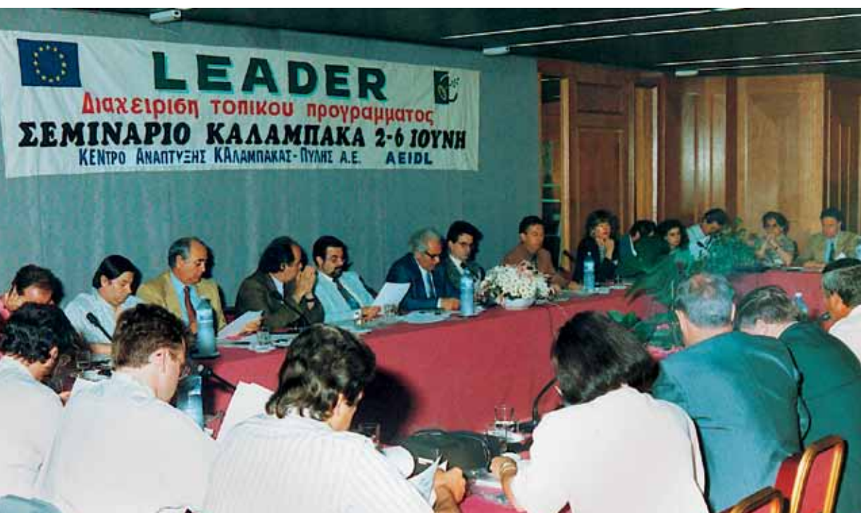
Ervaringen uitwisselen: een LEADER-seminar in Kalabaka [Griekenland]