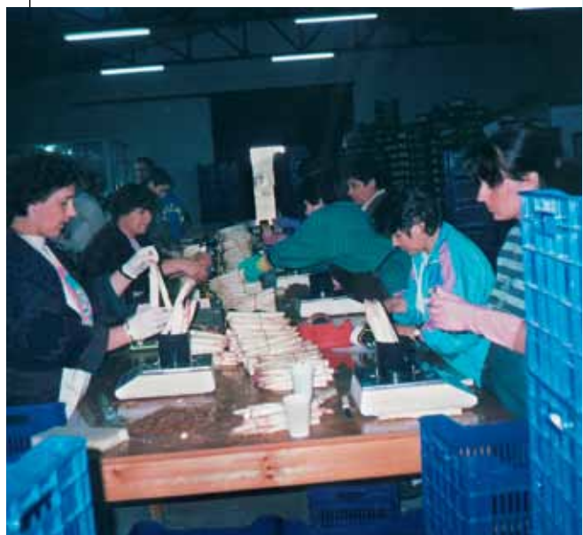
Verpakking van asperges in de coöperatie van Tychero