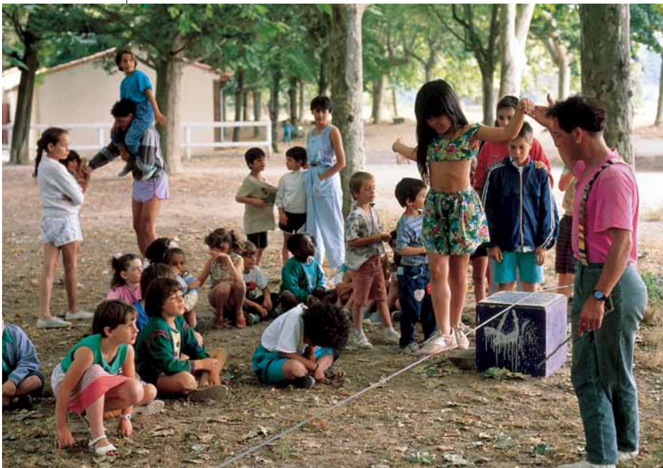
Animatie in een plattelandsschool in het Pays Cathare [Frankrijk]

Ten slotte pleitten de deelnemers van de workshop voor het principe van “de vervuiler betaalt”, met name op het gebied van het landbouwbeleid. Ze willen het gebruik van milieuvriendelijke productiemethoden stimuleren door compensaties toe te kennen.