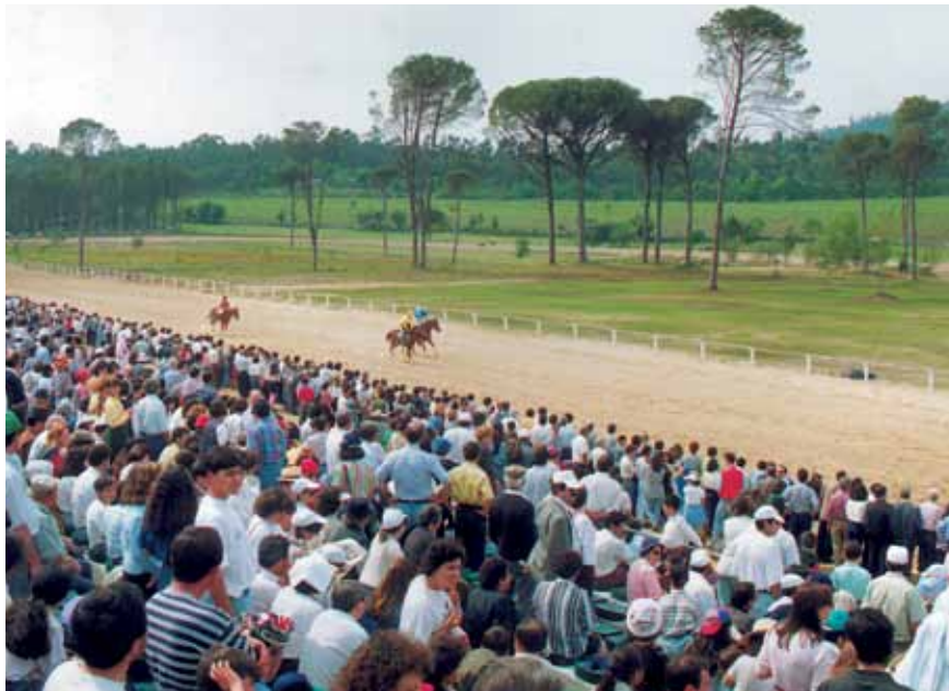
De Grote Prijs van Portugal 1994 in het Paardensportcentrum van Ponte de Lima [LEADER-gebied Vale do Lima]