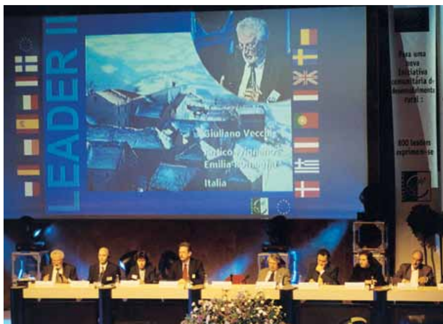
Den italienske LEADER-gruppe Antico Frignanos oplæg