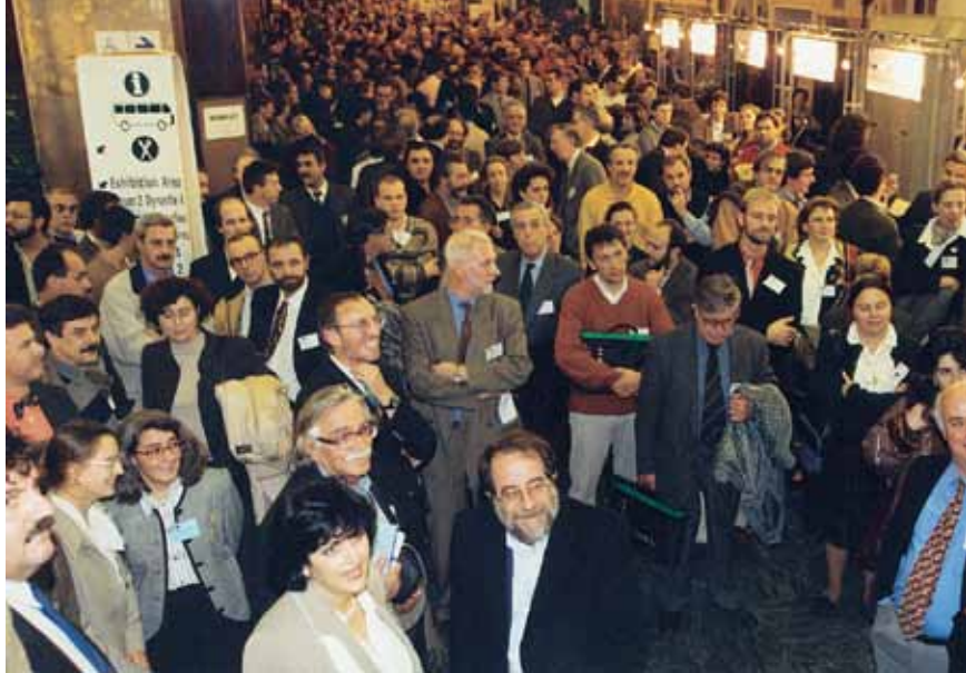
Et nærbillede af "leaderne"

kommer til at omfatte en "lokaludviklingsdel", som skal videreføre LEADER-ånden og -ordningerne for at sikre, at LEADER og de øvrige mål-programmer er sammenhængende og komplementære. Mange af indlæggene indeholdt et ønske om: