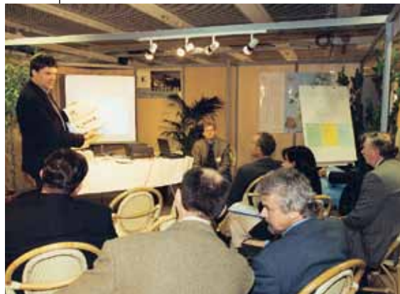
■ Den tyske lokalaktionsgruppe Bayerwalds præsentation på Det Europæiske LEADER-Observatoriums stand

I løbet af den samme mødedag blev der desuden organiseret seks “fora”, som var navnet på en række mini-konferencer, der præsenterede LEADER i de forskellige medlemsstater, og initiativer fra en lang række af Europa-Kommissionens generaldirektorater til fordel for udviklingen af landdistrikterne. Det handlede om at skabe bedre kendskab til den samfundsøkonomiske og institutionelle sammenhæng og gennemførelsesbestemmelserne for LEADER i hver af landene i Unionen