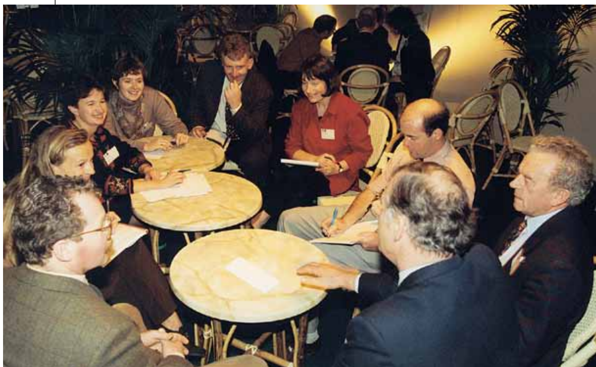
Et af de 33 debattmøder om samarbejde

At dømme efter den succes, som kollokviet i Bruxelles havde med sit “samarbejdsområde”, vil man uden tvivl opleve en hastig udvikling af denne dimension, som spiller en central rolle i LEADER (der er afsat over 100 millioner ECU til formålet under afsnit C). <