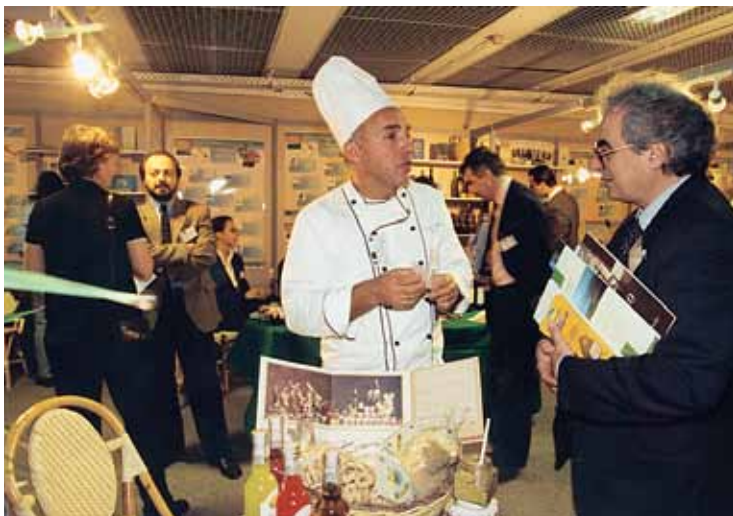
■ “Chefkokken” på den italienske LEADER-stand

Udover plenarmøder og workshops, var der på kollokviet også et stort antal aktiviteter, som fremviste de europæiske landdistrikter som levende, initiativrige og hyggelige.