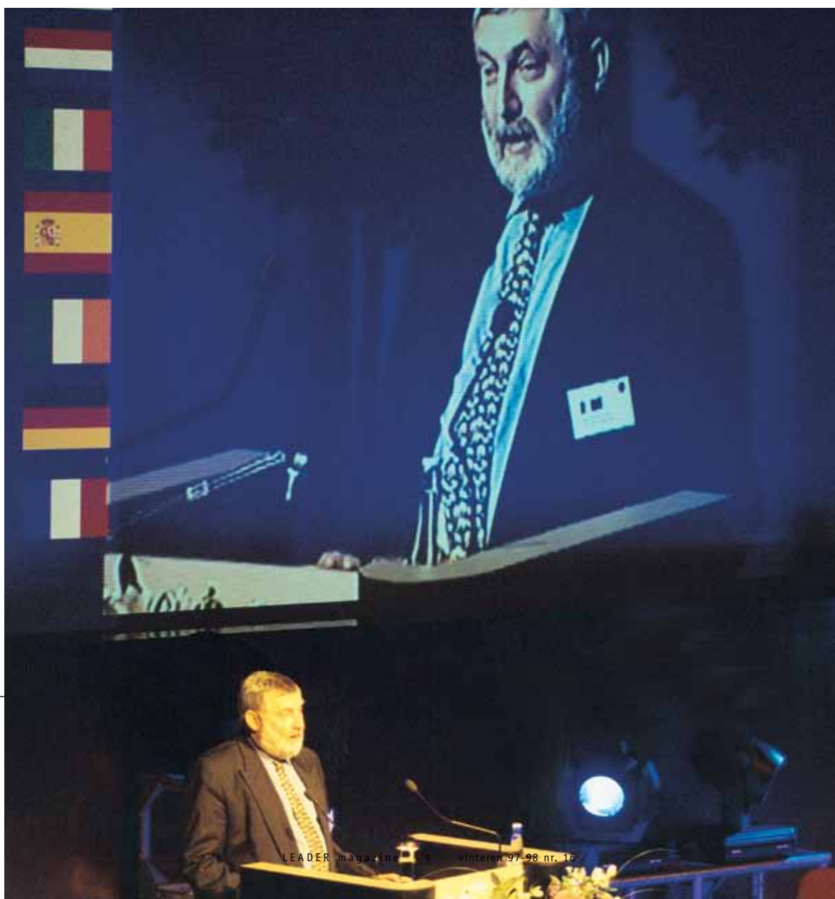
Hr. Franz Fischler, medlem af Europa- Kommissionen, med ansvar for landbrug og landdistriktsudvikling

Kollokviet i Bruxelles dannede ikke blot ramme om stor erfaringsudveksling og indledning til samarbejde, men også om definitionen af den rolle, som LEADER spiller i de europæiske landdistrikters udvikling. Initiativtageren til mødet, kommissær Franz Fischler, meddelte, at han til fastlæggelsen af programmet for perioden 2000-2006 ville foreslå et nyt fællesskabsinitiativ for landdistrikternes udvikling med udgangspunkt i en uddybning af hovedlinierne fra LEADER.