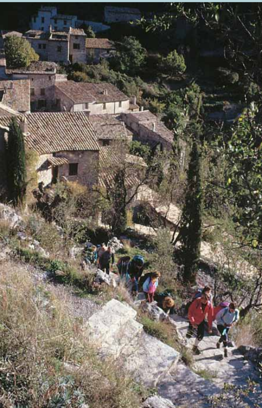
Livskvalitet i landområder – det er vigtigt at drage fordel af lokalmiljøet og den natur- kulturhistoriske arv