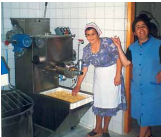
Kooperativet St-Georges [Kozani, Grækenland]

Gruppen Campo de Calatrava (Castilla-La Mancha) har støttet oprettelsen af et kooperativ til fabrikation og markedsføring af kniplingearbejde ("Encajes de bolillos"). Virksomheden har til formål at hjælpe kvinder over 45 år og under 25 år ind på arbejdsmarkedet, og der er allerede oprettet 6 arbejdspladser.