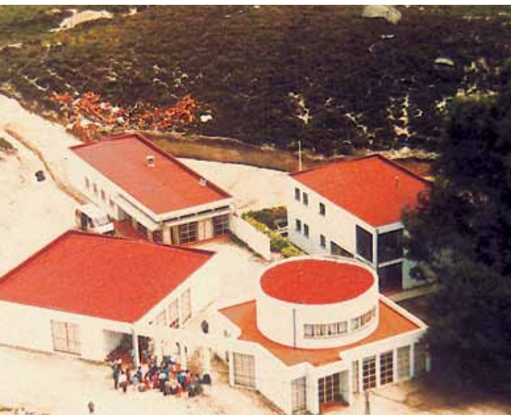
Medborgerhus og håndværkscenter i Covide [Alto Cávado]