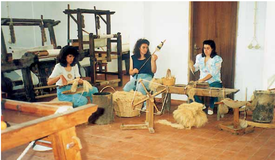
Et kooperativ af kvindelige håndværkere støttet af LEADER