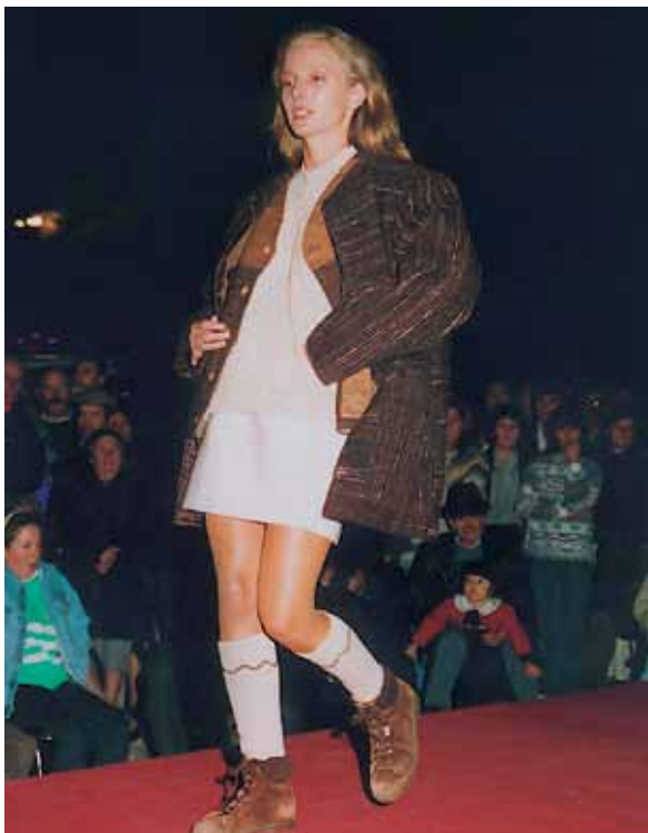
Fremme af den lokale kunst: modeopvisning finansieret af gruppen Alto Tâmega

Med baggrund i af de store forandringer, som de portugisiske landdistrikter har været ude for i de seneste 10 til 15 år, forekommer kvinderne dårligt rustet til at tjene til livets ophold og indtræde i den formelle økonomi. De er dårligt uddannet, de har få muligheder for at opnå lønnet beskæftigelse, da det lokale marked er meget begrænset. Selvbeskæftigelse er således i næsten alle tilfælde den eneste løsning, og kunsthåndværket (især tekstil i denne del af landet) er den sektor, der lader til at have mest potentiale. De lokale udviklingskontorer vil med støtte fra de portugisiske myndigheder (Udvalget for kvindespørgsmål, Institut for håndværksmæssige