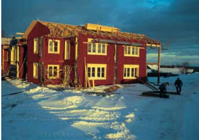
Construcción de una residencia de ancianos en Byssbon