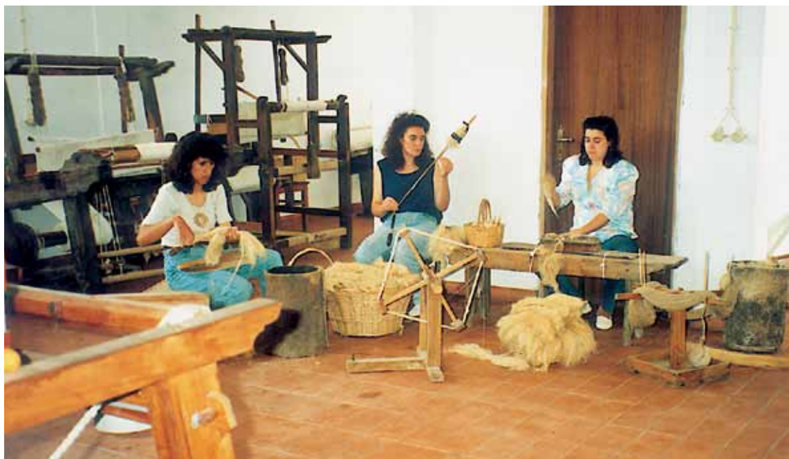
Cooperativa de artesanas apoyada por LEADER