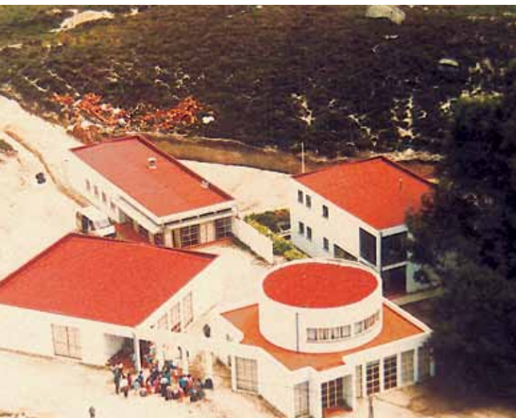
El Centro social y artesano de Covide [Alto Cávado]