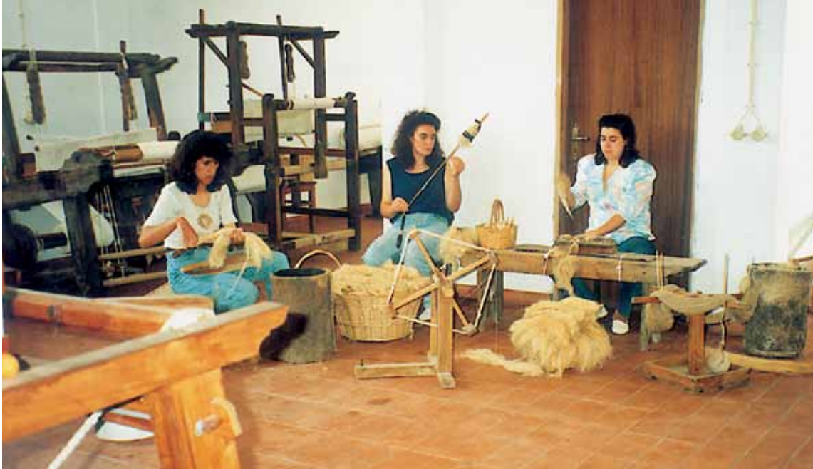
LEADER-ohjelman tukema käsityöläisten osuuskunta