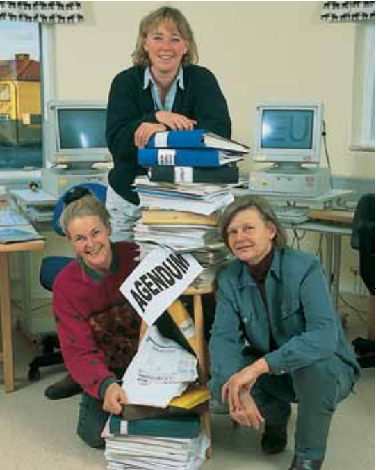
Paikallisen kehityksen palveluksessa: Agendum-osuuskunta

Viisikymmentä kilometriä pohjoiseen Östersundista, hallintoalueen pääkaupungista ja ainoasta Jämtlandin merkittävästä kaupungista, Lappiin vievästä tiestä jonkin verran syrjässä sijaitsee kolmen kylän, Högaranin, Fagarlandin ja Ollstan muodostama kokonaisuus. Asukkaita niissä on yhteensä 130. Tulevaisuus näytti 80-luvun puolivälissä varsin synkältä: soratie oli säällittävässä kunnossa, linja-autoreittiä, kauppaa ja varsinkin koulua uhkasi lopettaminen. Asukkaat reagoivat perustamalla vuonna 1985 mietintäryhmän, joka päätyi tilanearvioon ja määritteli toimintastrategian: "Yleisajatuksena oli palvelujen parantaminen