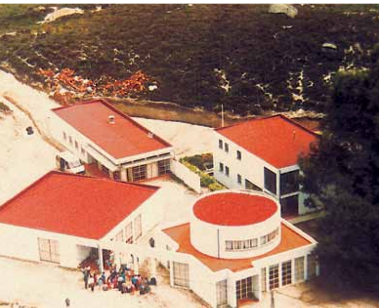
Coviden sosiaalinen ja käsiteollisuuskeskus [Alto Cávado]