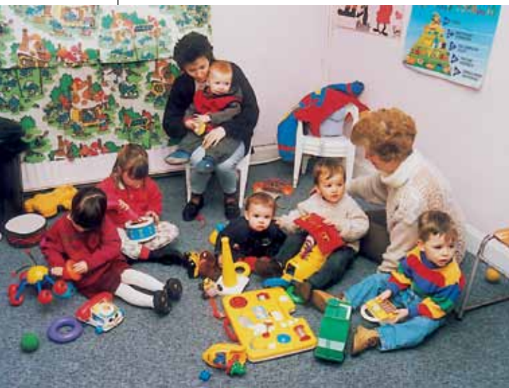
Tijd vrijmaken voor beroepsactiviteiten: kinderopvang in Kanturk [LEADER-zone Duhallow, Ierland]

Datzelfde principe vormt de basis voor een opleidingsprogramma in de Haute-Vienne (Frankrijk): door vrouwen de mogelijkheid te bieden buschauffeur te worden, krijgen de plattelandsvrouwen meer tewerkstellingsmogelijkheden en wordt tegelijk het probleem aangepakt van de mobiliteit van personen zonder eigen vervoer. In een geïsoleerde streek van Noord-Ierland zorgt een zeer succesvol privébedrijf, Kinawley Integrated Teleworking Enterprise Ltd. (KITE), in een boerderij voor opleiding en telewerk (14 rechtstreekse arbeidsplaat-