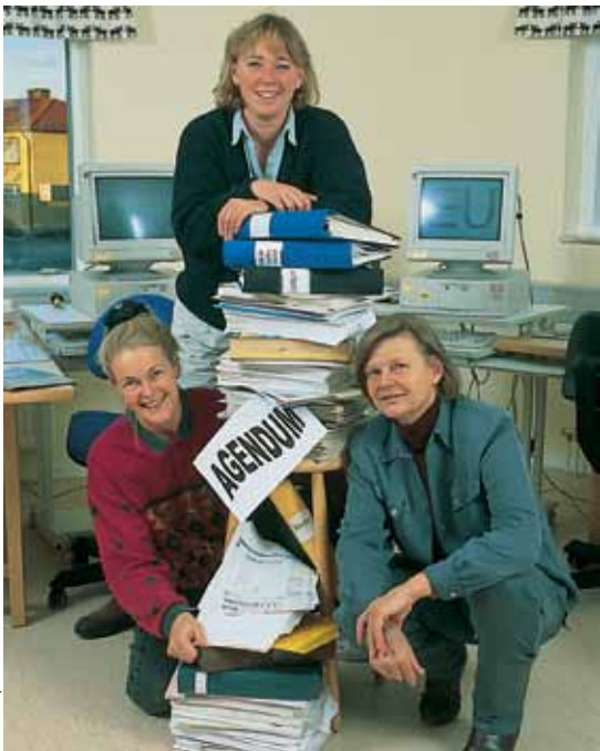
Ten dienste van de lokale ontwikkeling: de coöperatie Agendum

Hun toekomst zag er maar somber uit in het midden van de jaren ‘80: de grindweg verkeerde in een lamentabele staat, de autobuslijn, de winkel en vooral de school waren met sluiting bedreigd. De inwoners reage-