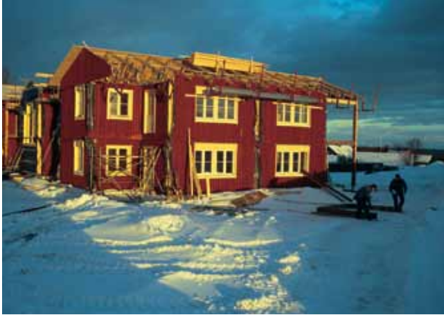
Bouw van het bejaardentehuis van Byssbon

ren door in 1985 een bezinningsgroep op te richten, die een diagnose stelt en een strategie bepaalt: