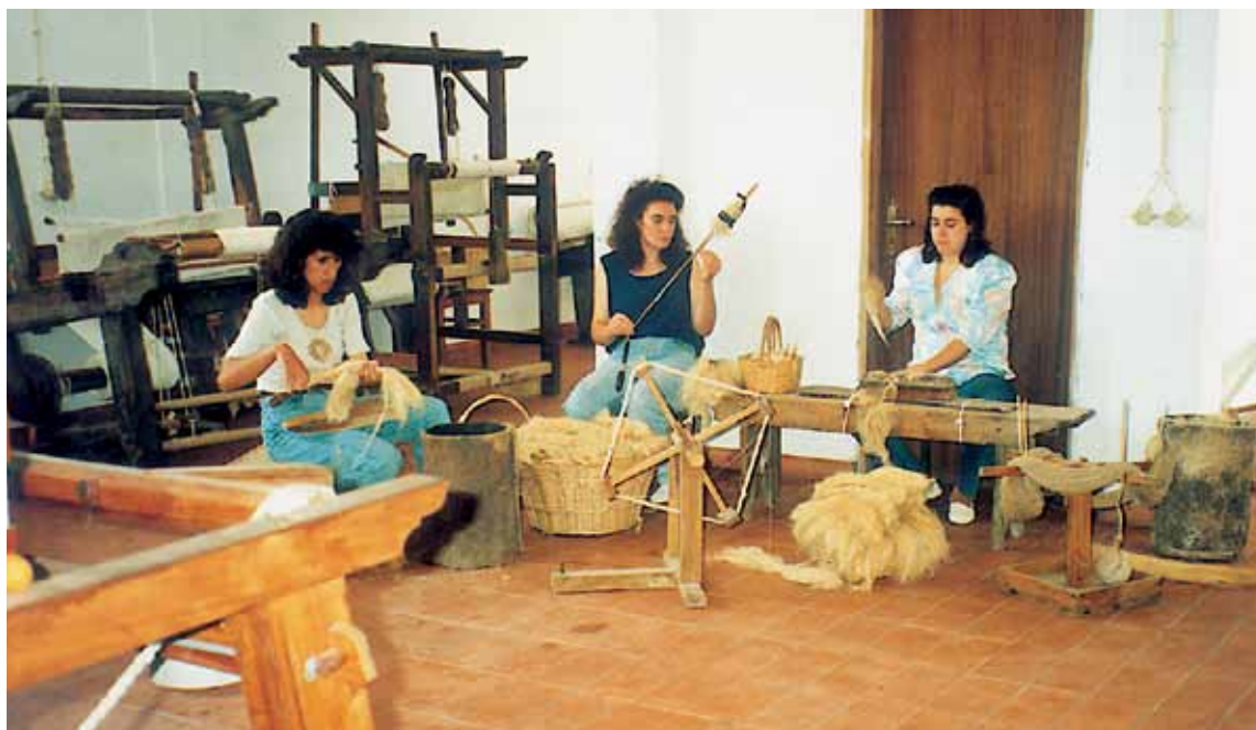
Coöperatie van ambachtswomen gesteund door LEADER