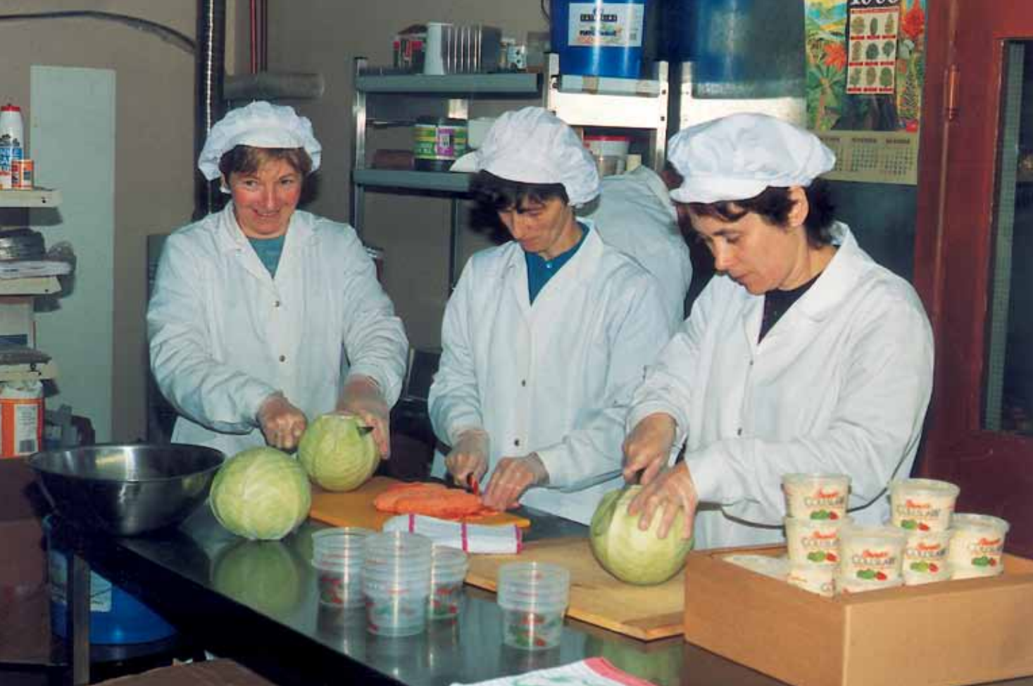
Bedrijf voor klaargemaakte gerechten [Inishowen, Ierland]