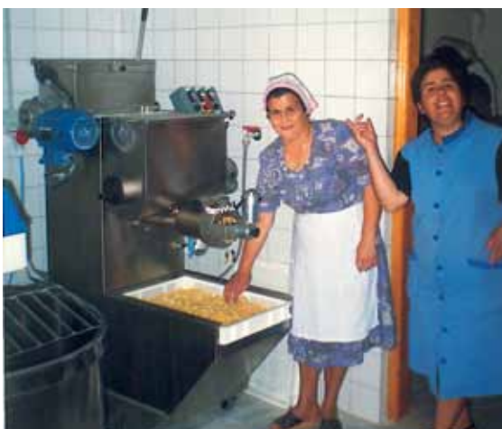
Coöperatie van St-Joris [Kozani, Griekenland]

De groep Campo de Calatrava (Castilië-La Mancha) heeft de oprichting gesteund van een coöperatie voor de fabricage en de verkoop van kloskant ("Encajes de bolillos"). Het bedrijf dat gericht is op het verstrekken van werk aan vrouwen van meer dan 45 jaar en minder