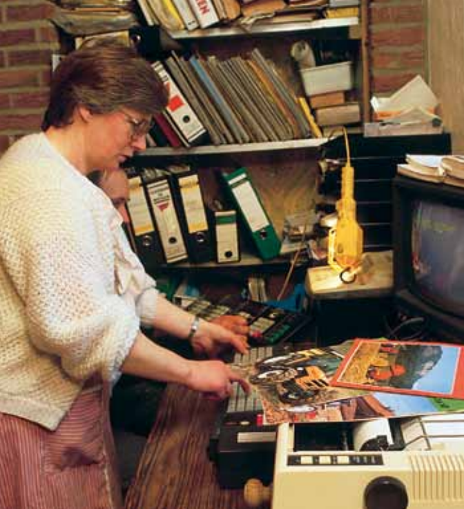
De "landbouwersechtgenote" zorgt vaak voor de administratie van het familiaal bedrijf

sen), voornamelijk voor vrouwen, naast een crèche voor hun kinderen. KITE werd opgericht door drie vrouwen en kende in het begin veel problemen om financiële hulp te krijgen van de ontwikkelingsagentschappen. De bedrijfsleiders wijten deze problemen aan het gebrek aan "visie" van de benaderde agentschappen, die ongevoelig bleken voor het feit dat het project werd geleid door vrouwen en dat het om een combinatie ging van twee nieuwe activiteiten in de streek: telewerk gecombineerd met kinderopvang.