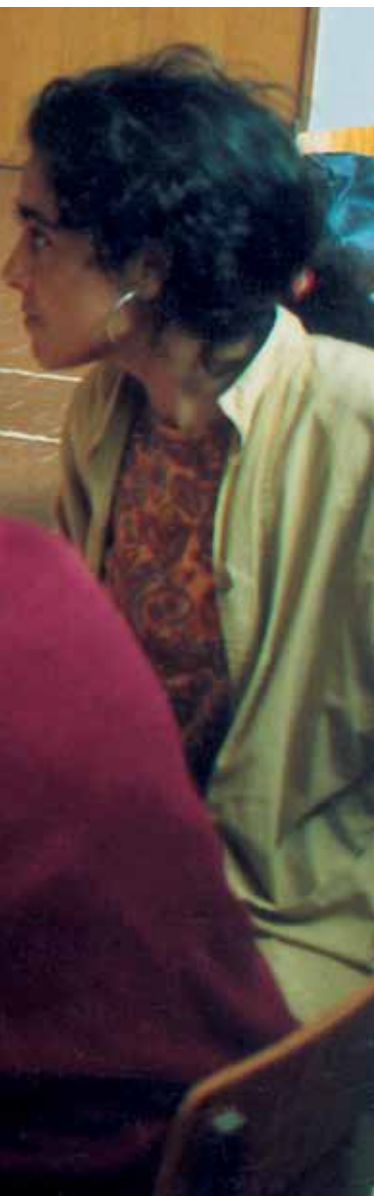
Opleiding van "plaatselijke animatrices" [Serra do Caldeirão, Portugal]

De volgende voorbeelden gaan over een aantal LEADER I-acties waarbij vrouwen rechtstreeks werden aangesproken. →