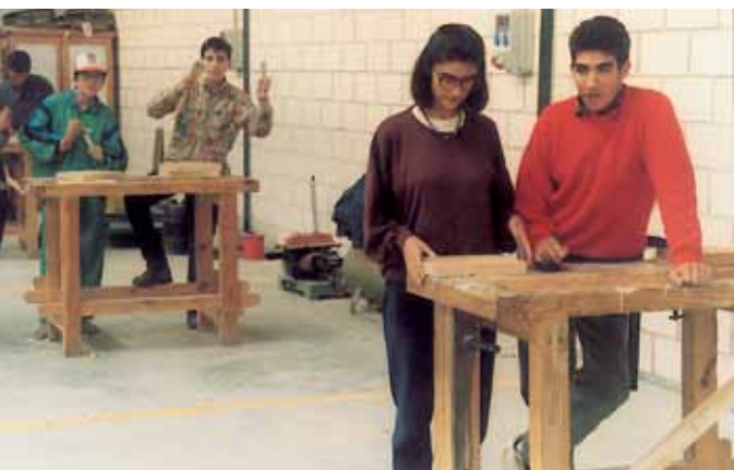
Opleiding schrijnwerkerij [Sierra Sur de Sevilla, Spanje]

Ook in Thessalië heeft de groep Elassona haar steun verleent aan ambachtsvrouwen die folkloristische kostuums en "kilims", zeer befaamde geweven tapijten, maken. De LEADER-actie heeft de modernisering van deze traditionele activiteit mogelijk gemaakt en heeft de commercialisering van de producten vergemakkelijkt. De groep Evros (Oost-Macedonië) heeft deelgenomen aan de oprichting van een "Centrum voor Ambachten en Thuiswerk". Het wordt beheerd door vrouwen en wil de lokale ambachtelijke productie en de permanente vorming van de vrouwen in de zone aanmoedigen. <