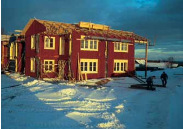
Byssbon bygger servicehus för äldre