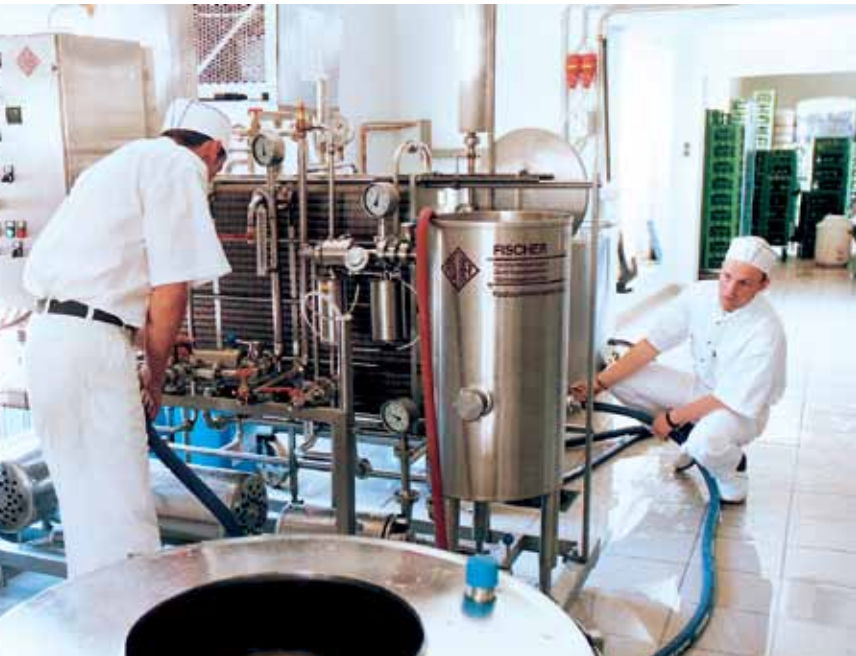
Sonnenalmin osuuskunta toimittaa maitotuotteita Norische Regionin kouluille

ymmärtää mehiläisen merkityksen luonto- ja kulttuuriperinnön kantajana.”