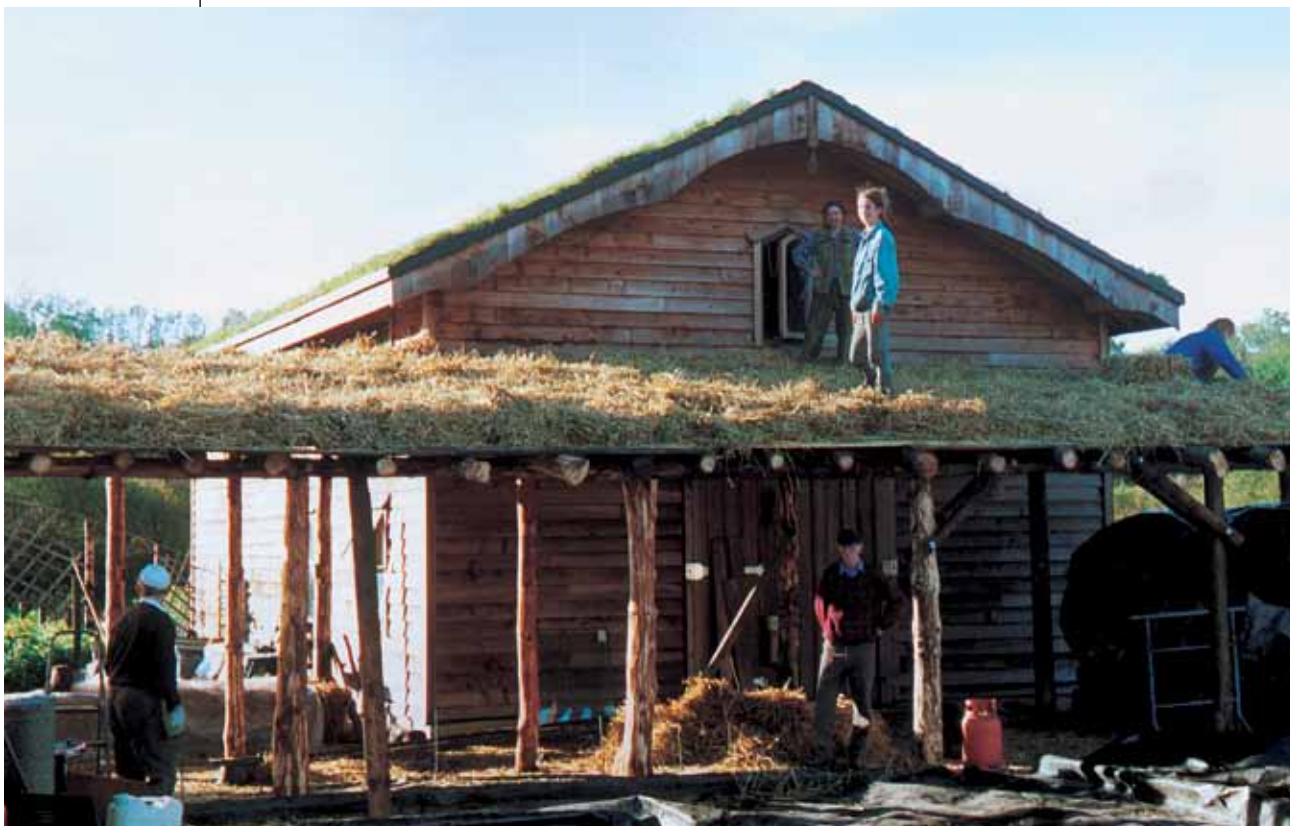
McCaben maatilalla sijaitsevat rakennukset on rakennettu täysin ekologisesti

Ensimmäinen monipuolistamisen aalto 60-luvulla koh- distui etenkin kahteen ”perinteiseen” maataloustuotan- non alaan. Monet maanviljelijät siirtyivät kasvattamaan siipikarjaa (tällä hetkellä 55% kansallisesta tuotan- nosta) ja sikoja (20%). Mutta vasta sienien viljely, joka muutamaa vuotta myöhemmin laajuutensa, uudistavan luonteensa ja Irlannin taloutta kohentavan vaikutuk- sensa vuoksi oli ensimmäinen ”Kiinan suuri harppaus” paikalliselle kehitykselle.