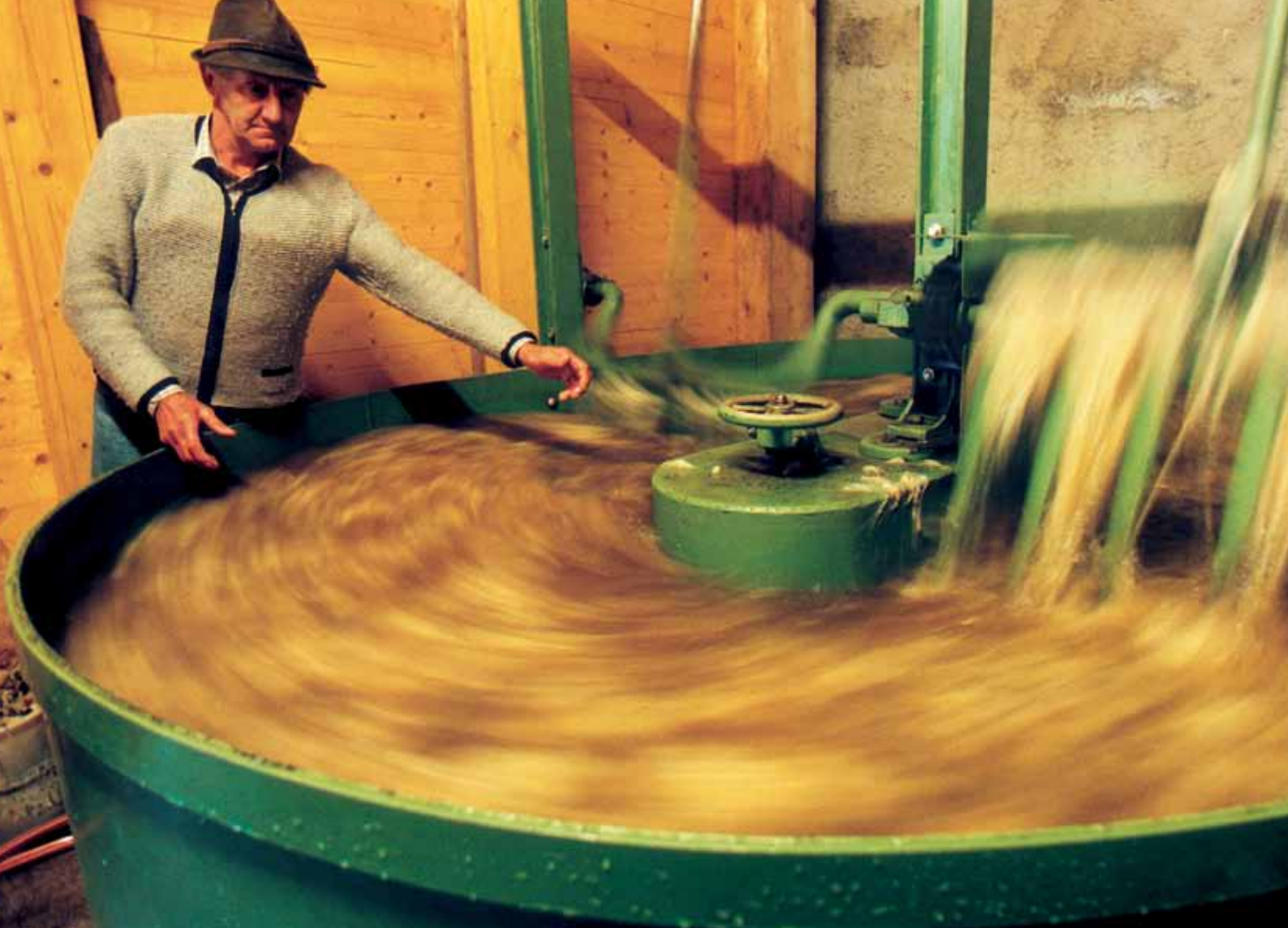
Uldvaskning i alpedalen Möll