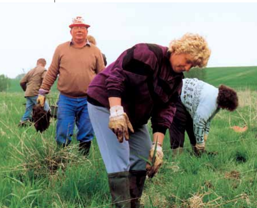
Nedplantning af siv i forbindelse med genopretningen af et vådområde (LEADER Ostvorpommern , Tyskland)

Den anden kategori af immaterielle produkter gælder produkter tilknyttet naturen, miljøet, vandet, landskaberne og tilvejebringelsen af en balance i det lokale miljø. Det er klart, at et land – og i endnu højere grad et kontinent – der vedligeholder sine naturlige ressourcer, er rigere, også fra et økonomisk synspunkt, end et land, der er forurenat, overbelastet og udtømt. Denne rigdom skyldtes førhen landbruget, der sikrede en fuld udnyttelse af jorden. Forestillingen om den fødrene jord var en fordel i den forstand, at den enkeltes (landboens) og fællesskabets (lokalsamfundets) interesser kunne forenes. Produktivitetstankegangen har ved at behandle jorden som et stykke fast ejendom, der kun er noget værd, så længe det giver afkast, fritaget landmanden fra den opgave, der gik ud på at bevare det miljø, som han var knyttet til (i det mindste implicit) gennem den fødrende arv. Med andre ord, hvis vi ønsker, at landskaberne skal bevares, jorden skal være rig, vandet klart, naturen fuld af liv og miljøet bæredygtigt, så må vi fremover bidrage til at skabe dem, dvs. omsætte ønskerne i en frivillig politik, der kan debatteres i offentligheden. I dette perspektiv åbner der sig store muligheder for landmændene og for alle dem, der ønsker at udøve et virke i landdis-trikterne.