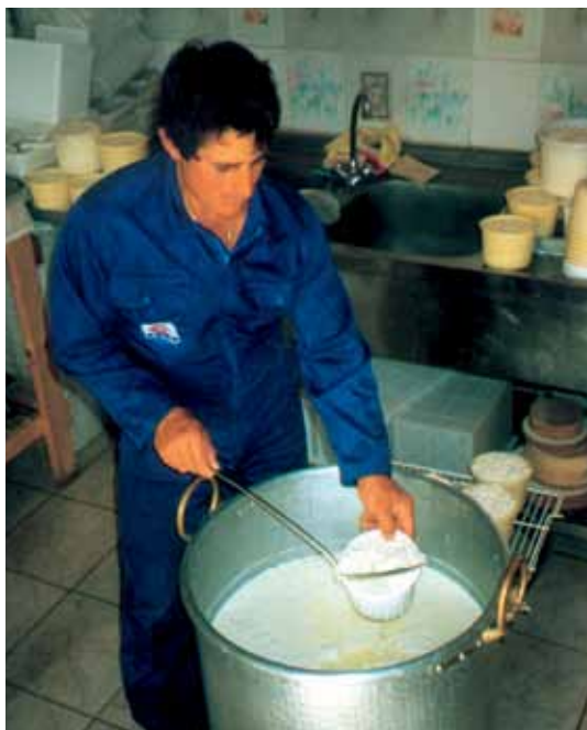
Fabrikation af fåreost i LEADER-området Rhodos [Grækenland]

rådet med en "standardiseret kvalitet". Der skal således udføres et stort stykke behørdigt arbejde for at opfylde disse komplementære og parallelle forventninger, der åbner op for nye perspektiver, som sikkert ikke er ubegrænsede, men i det mindste uundgåelige. En ting kan man være sikker på: I en sektor som levnedsmiddelsektoren, hvor efterspørgslen i allerhøjeste grad udvikler sig i tiden, er det kun de producenter, der kan håndtere en kompliceret tilbuds- og forhandlingsproces med utallige kulturelle hensyn, som vil kunne klare sig. Alle har forstået, hvad det drejer sig om. Fra nu af gælder kvalitetskravet ikke blot produktet selv, men også fremstillingsprocessen og de tilhørende hjælpemidler, som kan påvirke jordbunden og vandmiljøet.