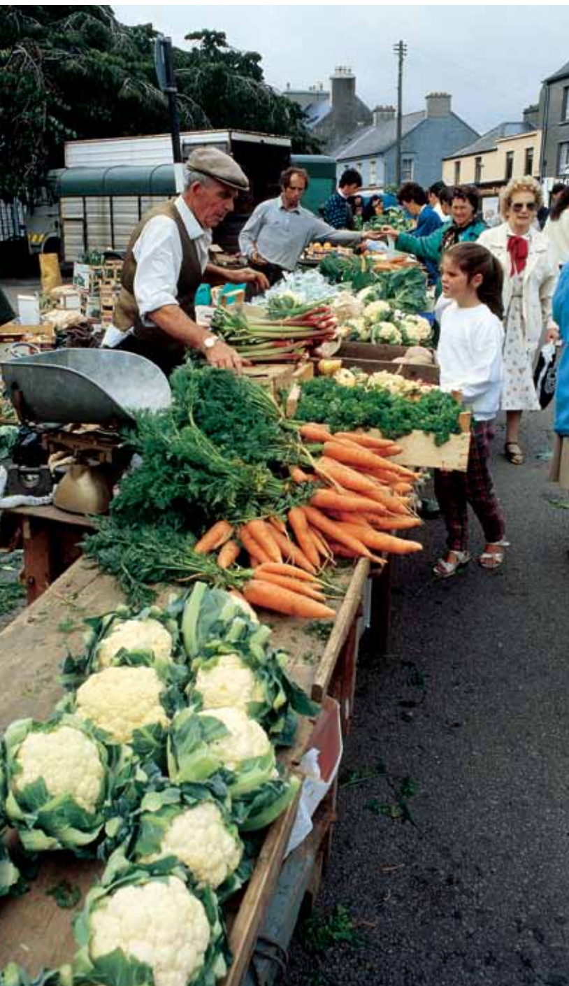
Marknad på landet i Connemara [Irland]