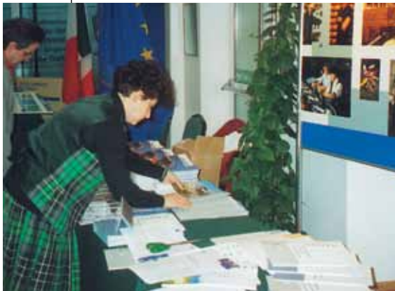
LEADER-ståndet görs i ordning