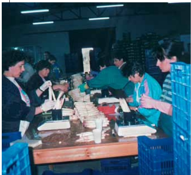
Förpackning av sparris i Tycheros kooperativ