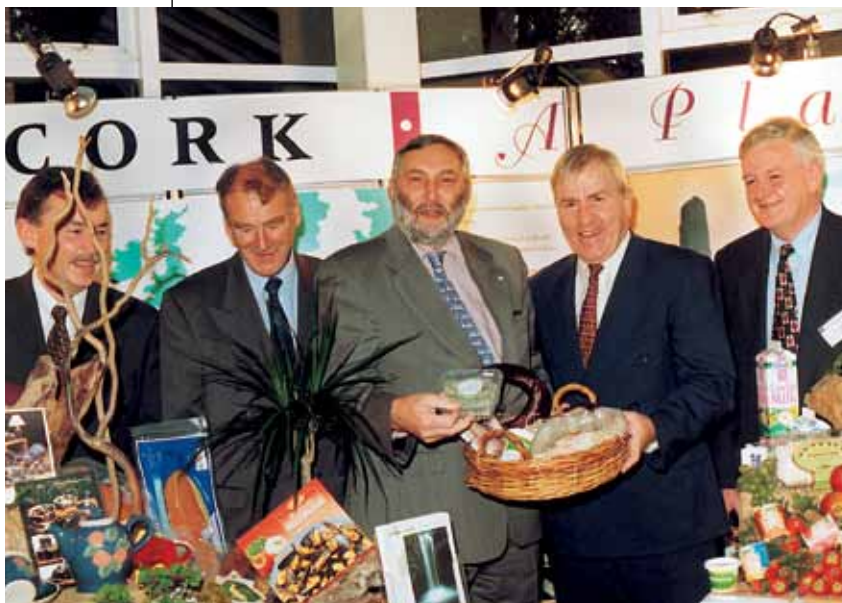
Franz Fischler, kommissionär, och Jimmy Deenihan, Irlands statssekreterare med ansvar för landsbygdsutveckling, tas emot av LEADER-gruppen West Cork

Slutligen kan noteras att ett tjugotal LEADER-grupper i Irland och England tog tillfället i akt för att samlas och fundera på med vilka medel de skulle kunna stärka programmets lokala förankring och ta hänsyn till gräsrotsaspekten samt organisera ett reguljärt samarbete i denna fråga (ett seminarium som "förenar de två öarna" planeras till våren 1997). <