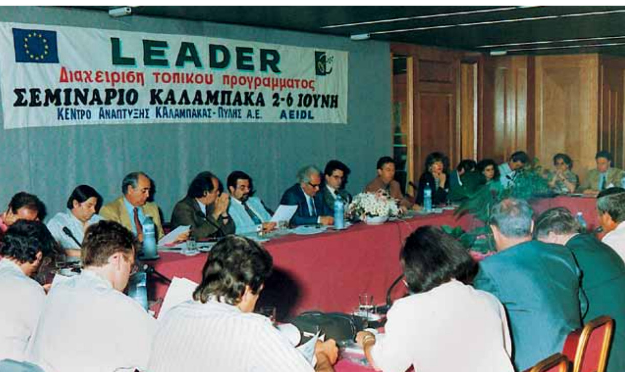
Dela med sig av erfarenheterna – LEADER-seminarium i Kalabaka [Grekland]