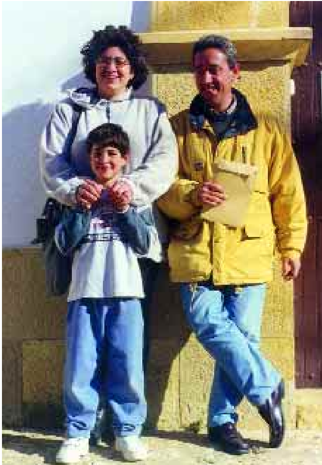
El presidente del grupo LEADER Mezquín (Aragón, España) y su familia son antiguos habitantes de la ciudad que en su momento decidieron afincarse en el medio rural