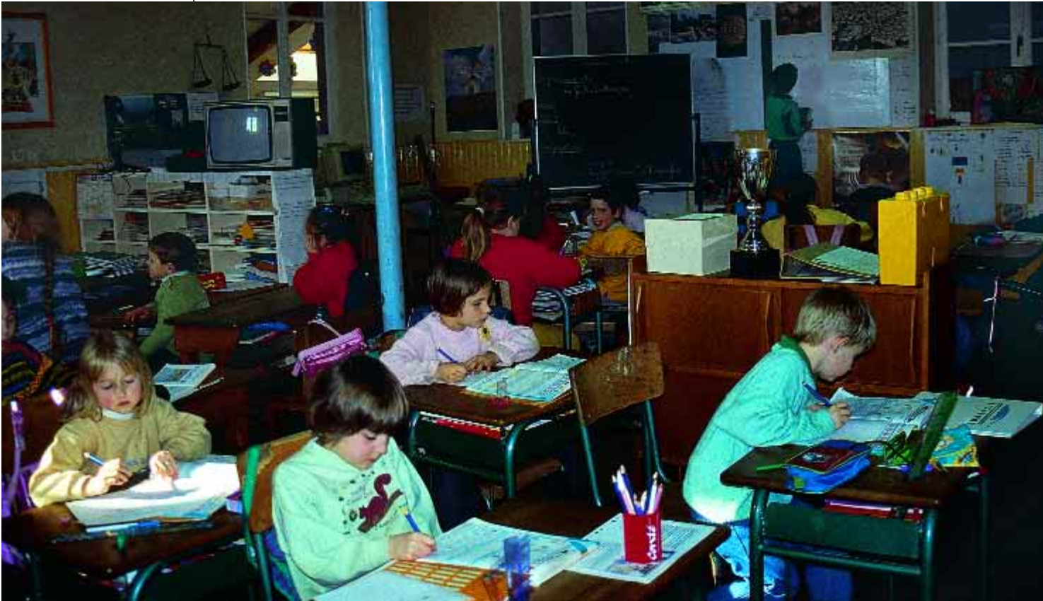
La escuela rural: su existencia es vital para el futuro del pueblo