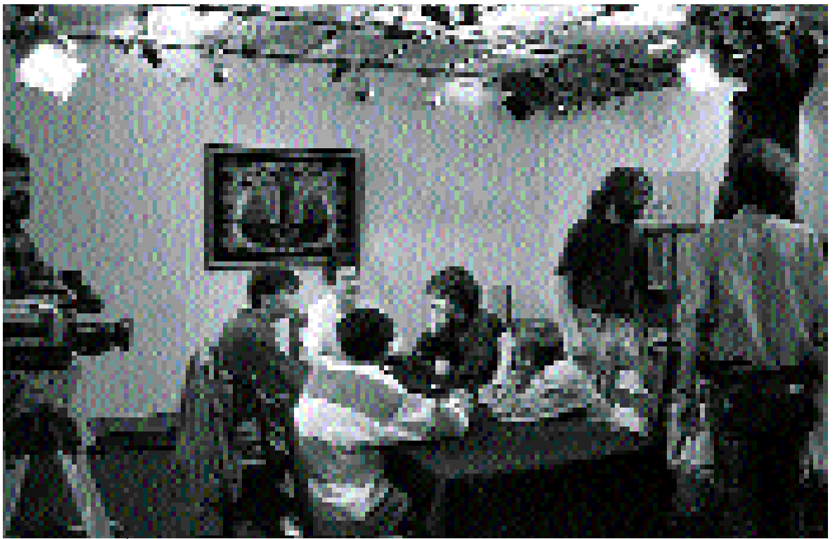
Creada y animada por la población local, “Télé Millevaches” aporta dinamismo a este territorio rural de Limousin (Francia)

La próxima etapa, por lo tanto, consistirá en estructurar el proceso de acogida. La idea que se baraja consiste en crear una red regional que incluya a socios técnicos y a encargados de misión de distintos territorios. De esta manera se podrá transponer al conjunto de la región una dinámica coherente y ciertas experiencias que sirvan de ejemplo.